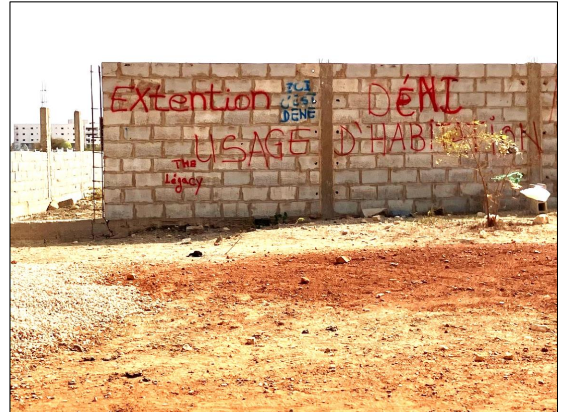
Tags revendiquant les périphéries loties du village comme zone d'extension (photo Armelle Choplin, 27/06/2024)