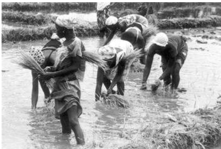
Figure 3a. Jeunes femmes diolas transplantant de jeunes plants de riz en Casamance au Sénégal