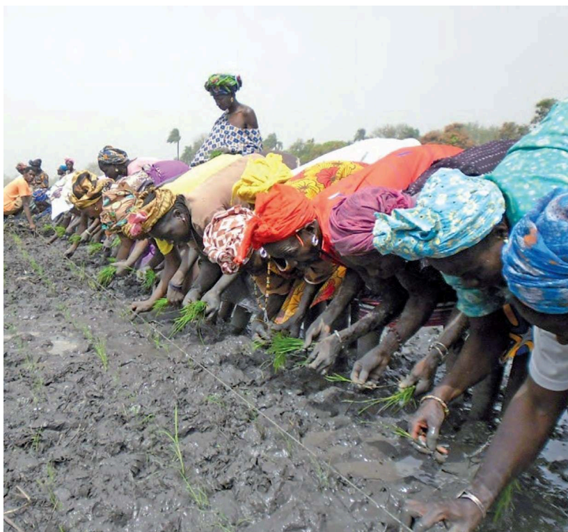
Figure 3b. Système de Riziculture Intensive (SRI) pratiqué par les femmes en Afrique de l'ouest