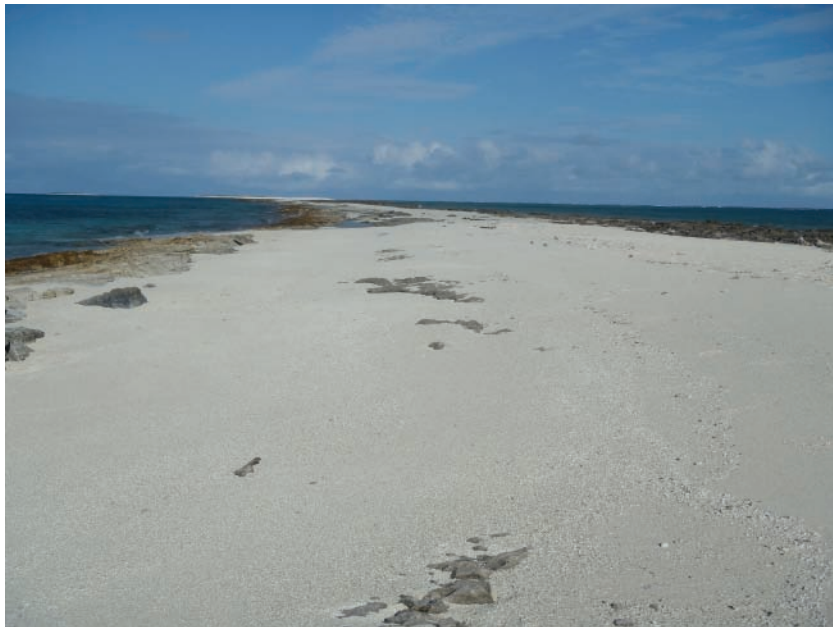
Vue de l'île Longue, îles Chesterfield.