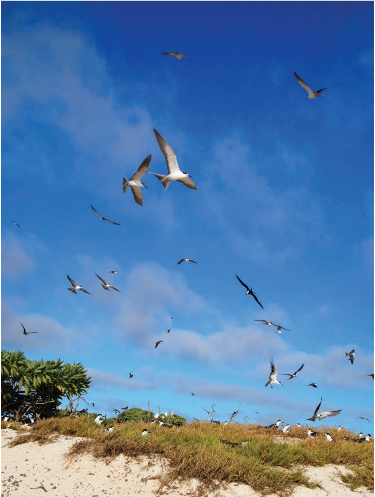
Colonie de sternes fuligineuses Onychoprion fuscatus .