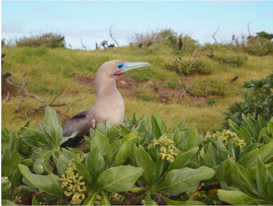
Fou à pieds rouges Sula sula de forme sombre sur les atolls d'Entrecasteaux.