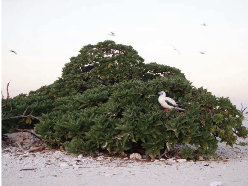
Fous à pieds rouges Sula sula de forme claire aux Chesterfield.