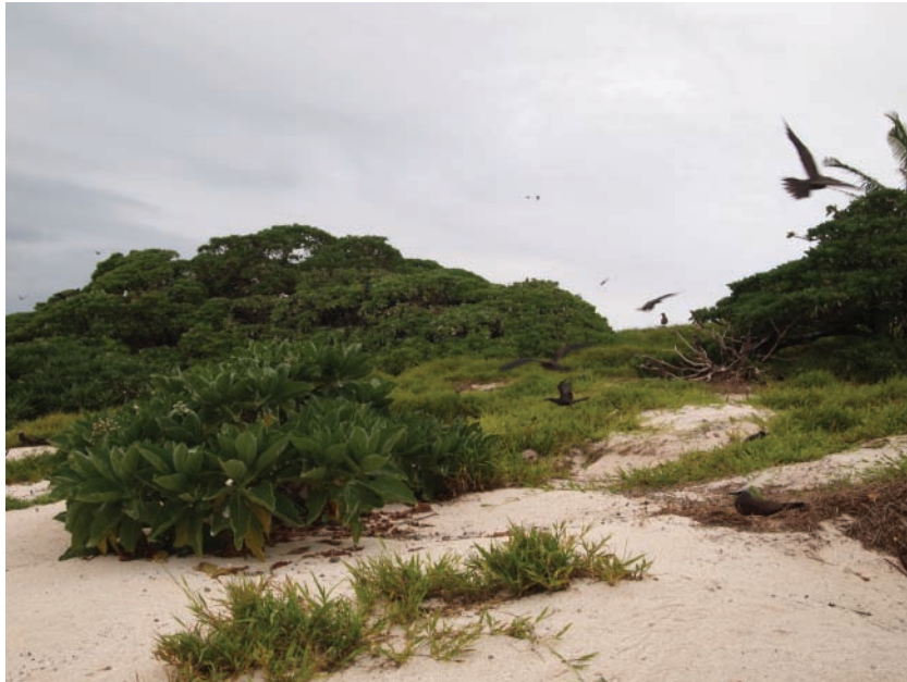
Noddis Anous sp. sur les atolls Chesterfield.