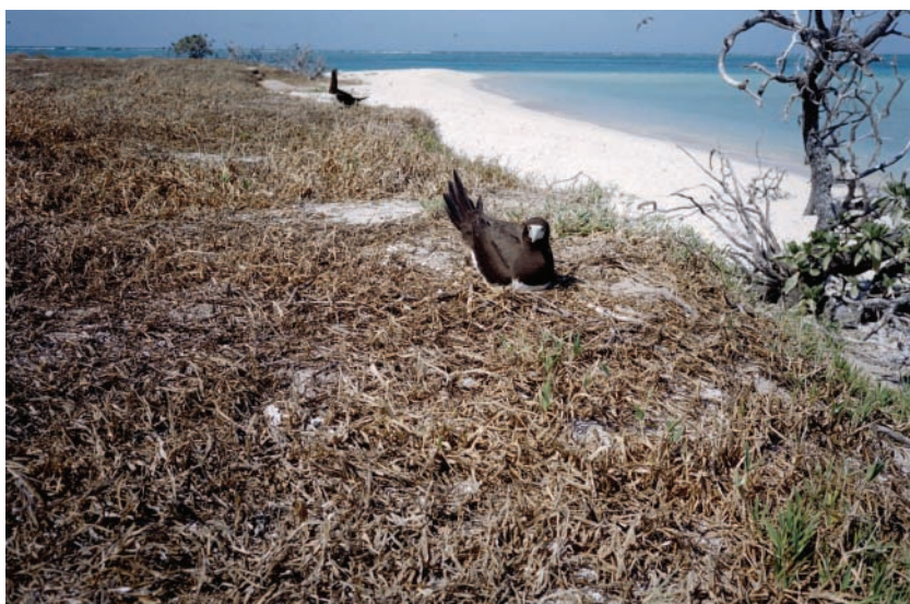
Fous bruns Sula leucogaster aux Chesterfield.