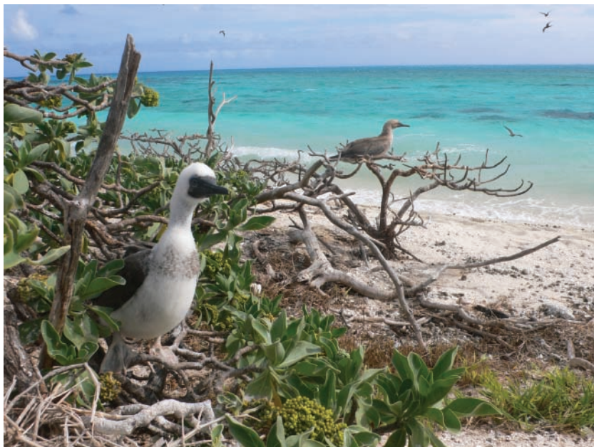
Fous à pieds rouges Sula sula .