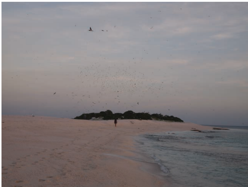
Vue des îlots du Mouillage aux Chesterfield.