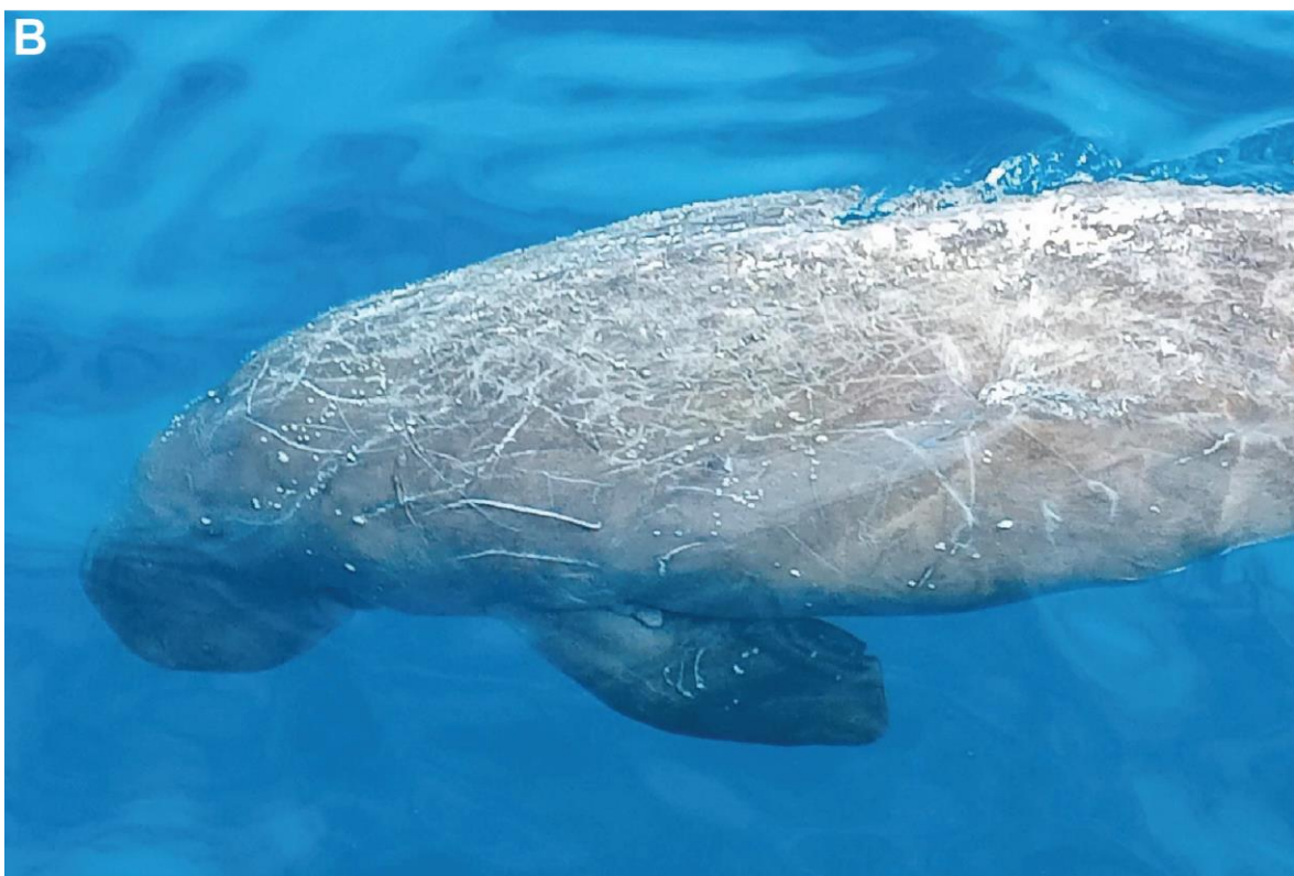
Fig. 1.- Dugong en surface, quasiment immobile ( 22^{\circ}06.50'S 166^{\circ}07'E ; 08 août 2021) montrant (A) le lobe caudal gauche presque complètement sectionné; (B) les abrasions et écorchures superficielles présumées avoir été causées par des congénères, ainsi que des balanes parasites.

Dugong at the surface, almost motionless ( 22^{\circ}06.50'S 166^{\circ}07'E ; 08 Aug. 2021) showing (A) its left caudal lobe almost completely severed; (B) abrasions and superficial scratches suspected to have been caused by congeners, as well as parasitic barnacles.