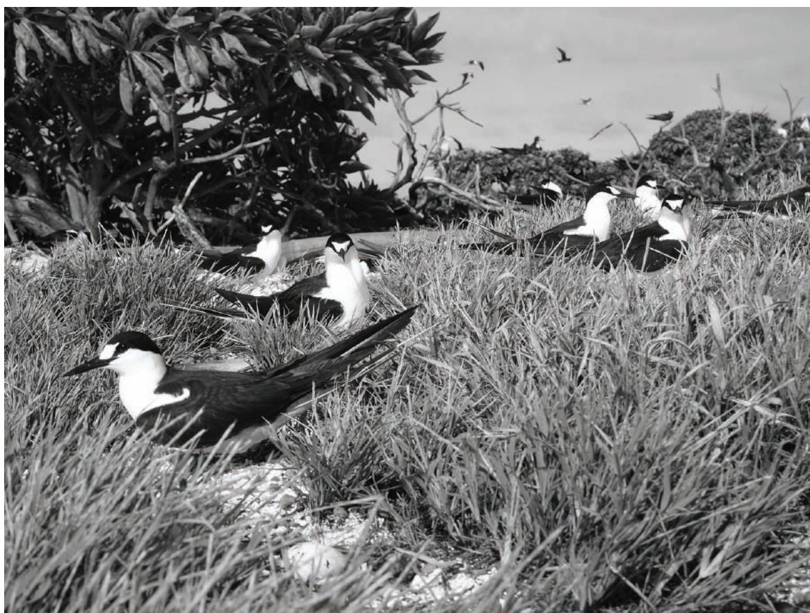
FIGURE 2. Sternes fuligineuses Onychoprion fuscatus en reproduction sur l'îlot du Mouillage n° 3, le 04 juin 2012 (IRD / P. Borsa, expédition MOMAlis).