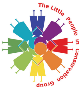
Fig. 4. Logo de l'association Little People in Conservation