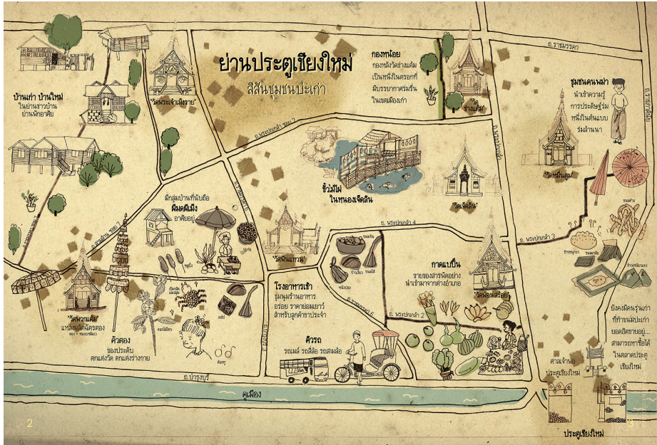
Fig. 2. Représentation cartographique du quartier Pratu Chiang Mai, illustrée par Supakul Panta, architecte du groupe Kon Jai Baan