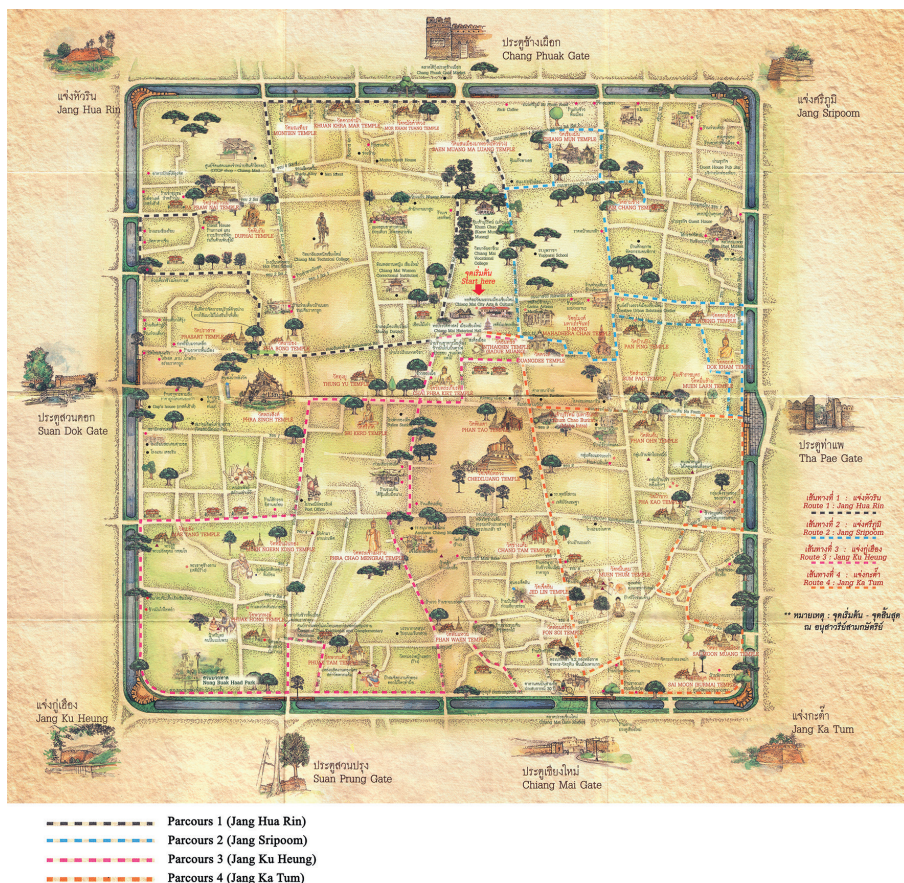
Fig. 5. Représentation cartographique de la « ville ancienne de Chiang Mai » (Mueang kao Chiang Mai) du projet Fuen Ban Yan Wiang