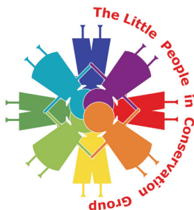
Fig. 4. Logo de l'association Little People in Conservation