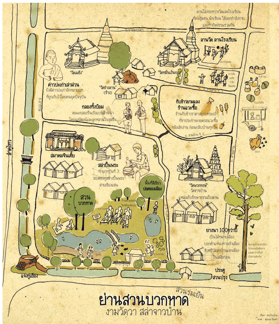
Fig. 3. Représentation cartographique du quartier Suan buak hat, illustrée par Supakul Panta, architecte du groupe Kon Jai Baan