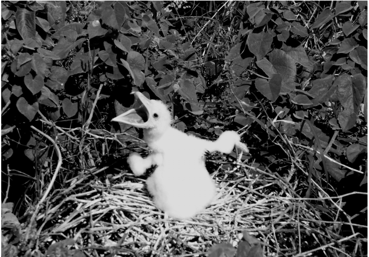
Figure 2. Les frégates (ici un poussin de Fregata minor dont le parent, dérangé par le débarquement d'un petit groupe de visiteurs, a abandonné le nid) sont particulièrement vulnérables au dérangement humain (Diamond 1975 ; Le Corre 1996 ; Spaggiari et al. 2007 ; Vidal et al. 2018). Les deux espèces de frégates présentes dans la mer de Corail, F. ariel et F. minor , se reproduisent notamment aux îlots du Mouillage (Borsa et al. 2010). Malgré la menace que représente la fréquentation humaine pour la reproduction des frégates, les îlots du Mouillage, où la compagnie Ponant compte laisser débarquer ses croisiéristes, ont été classés en simple « réserve naturelle » par Germain & Poidyalwane (2018b) (crédit : P. Borsa/IRD).