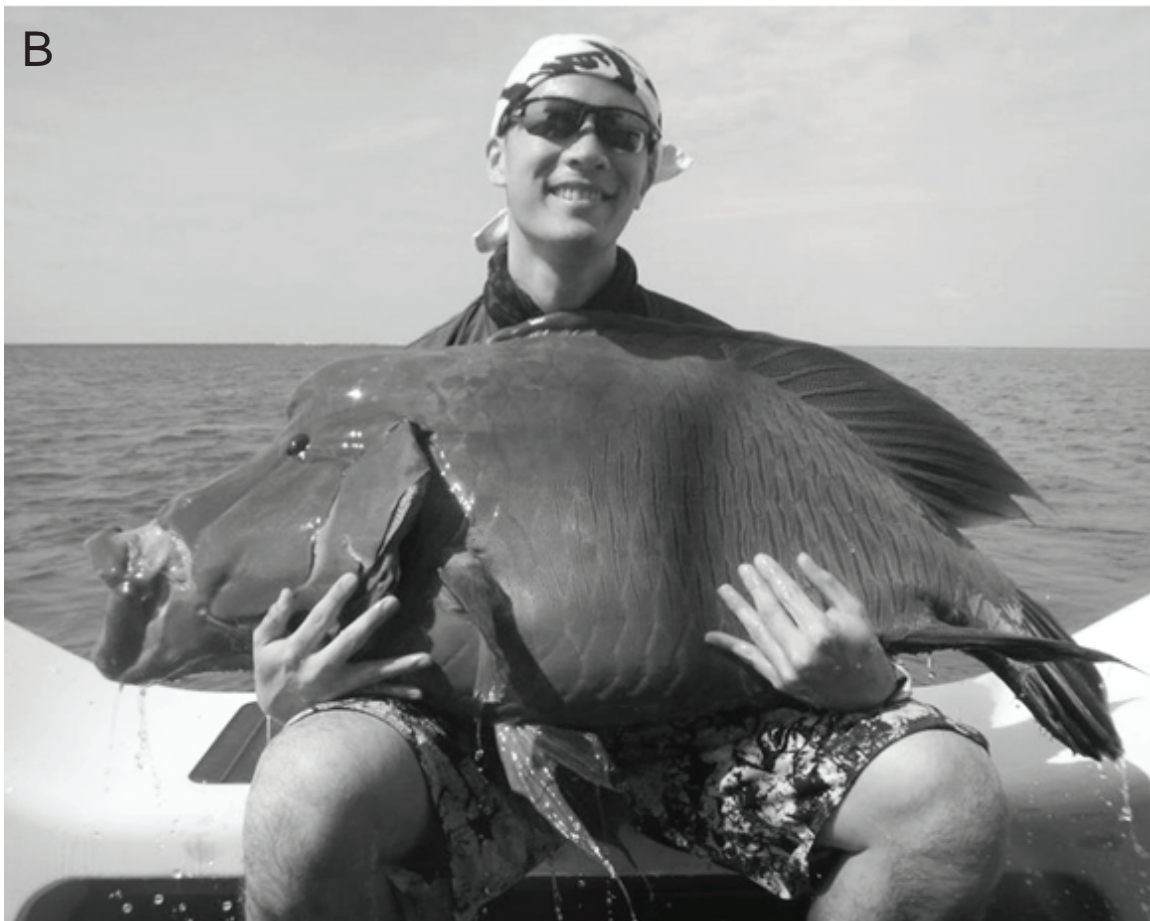
Figure 1. Touristes hilares exhibant leurs trophées de pêche lors d'une virée à bord du Quo Vadis. A. Carangues grosse tête Caranx ignobilis . B. Napoléon Cheilinus undulatus .