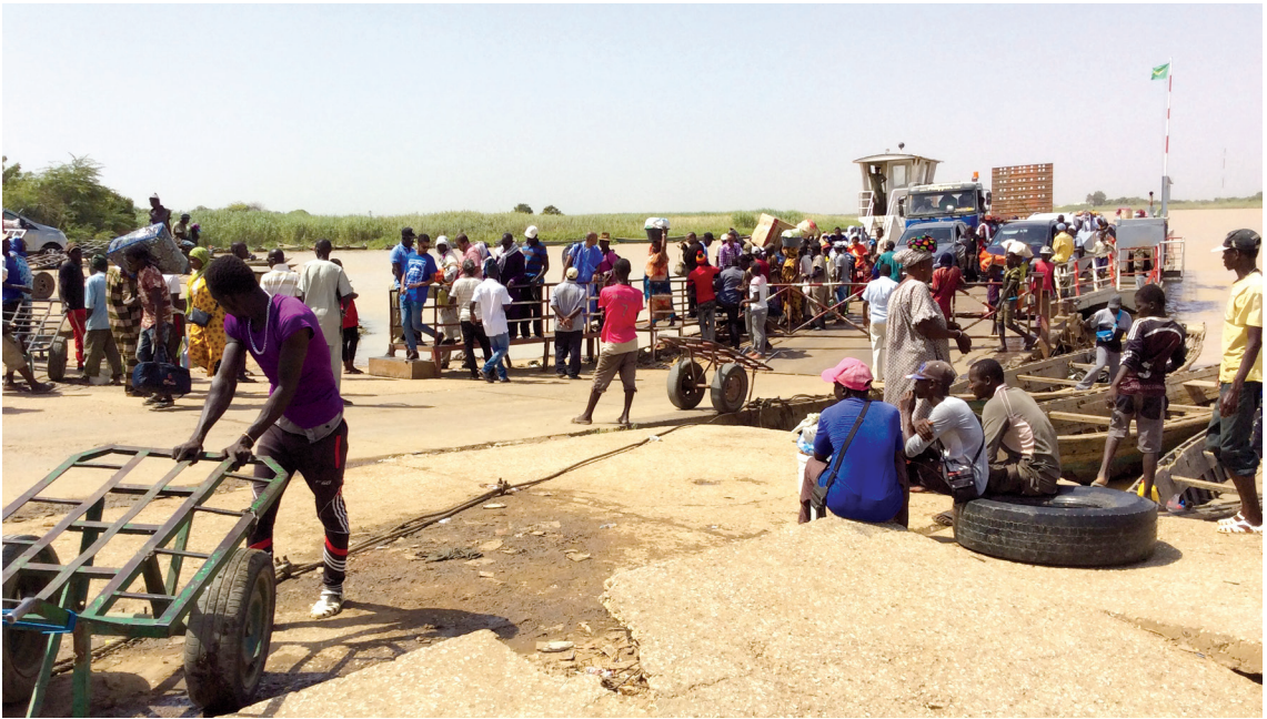
Arrivée à Rosso Sénégal du bac mauritanien

de France, résidents locaux, commerçants. Le croisement disciplinaire et le terrain partagé permettent d'avoir une perspective plus complexe du système socio-spatial de Rosso.