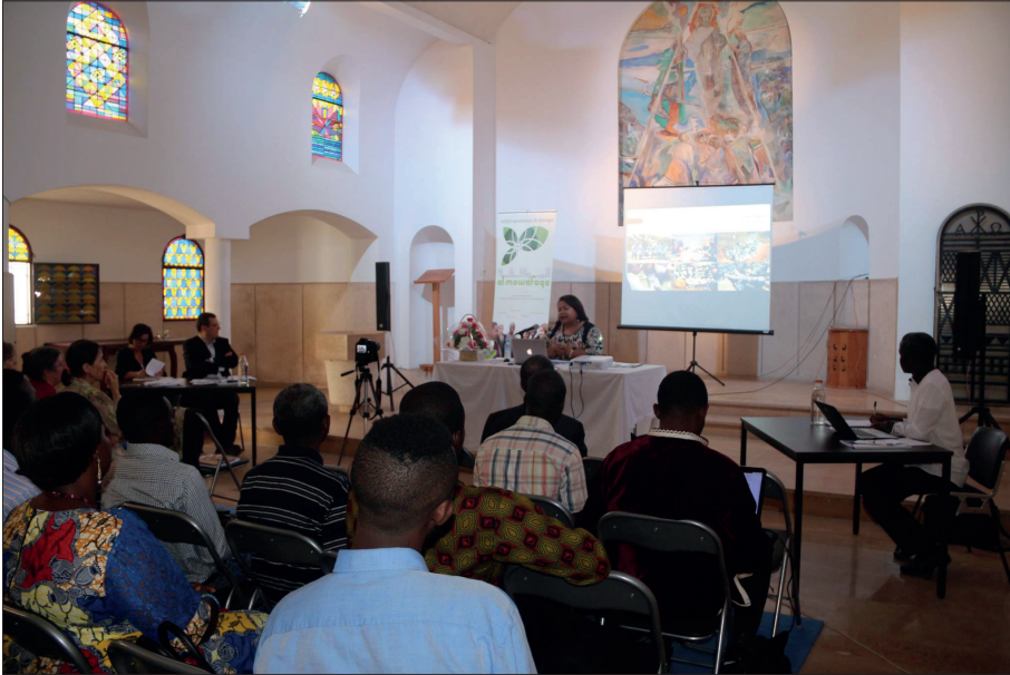
Photo 2 - Soutenance du mémoire de théologie dans la chapelle de l'Institut Al Mowafaqa

Cette fondation s'inscrit de la sorte dans une mémoire chrétienne au cœur de la ville, qui renaît et se développe dans un premier temps en écho aux migrations africaines comme nous allons le voir. Associés à une théologie de la fraternité, de la rencontre, du dialogue par l'histoire de ce lieu qui leur a été prêté, les fondateurs de l'Institut Al Mowafaqa, les deux responsables des églises, le directeur actuel mais aussi les membres du conseil scientifique et les professeurs sont aussi les acteurs à travers les formations et les conférences, d'une vision théologique qui se remet en mouvement, qui connecte les différents acteurs religieux et enseignants dans un nouveau contexte. Nous évoquerons ainsi par la suite les premiers impacts de cette formation dans les constructions théologiques actuelles au Maroc, ce que j'ai pu appeler la « théologie de la migration » (Bava, 2017), aussi bien dans les églises formelles qu'informelles que ce qui se dessine aujourd'hui autour d'une théologie de la pluralité religieuse 10 .