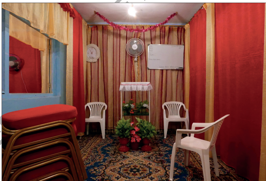
Photo 4 - Intérieur d'une église de quartier, J5, à Rabat