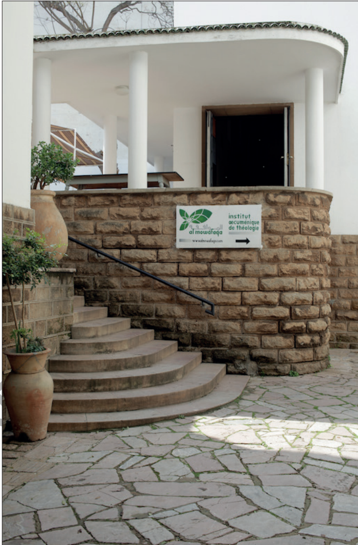
Photo 1 - Entrée de l'Institut Al Mowafaqa, Rabat, 2017

de réflexion, d'ouverture, de rencontre pour que des hommes et des femmes puissent arriver à se rencontrer, et apprendre à mieux se connaître, à s'estimer et à s'aimer. Mais avec "Al Mowafaqa", ce lieu prend encore une dimension plus universelle, car il se veut au service de ce qui se vit au Maroc mais aussi dans de nombreux pays d'Afrique avec l'espérance de s'ouvrir encore plus sur l'Europe 9 . »