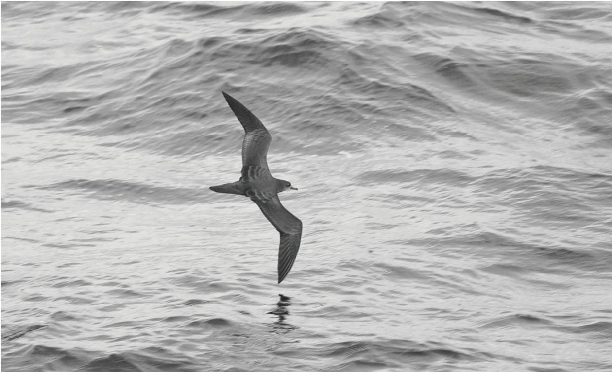
Figure 2. Le puffin pacifique est en déclin sur l'ensemble de son aire de distribution, victime de la destruction délibérée des oiseaux et des terriers, cible d'une surexploitation directe, proie des prédateurs introduits et prise accessoire de la pêche à la longue ligne (BirdLife International 2018a). La taille de population du puffin pacifique atteint plusieurs dizaines de milliers de couples dans le seul « V » des Chesterfield (Tableau 8), ce qui fait de cet ensemble une IBA d'importance internationale pour la conservation de cette espèce.