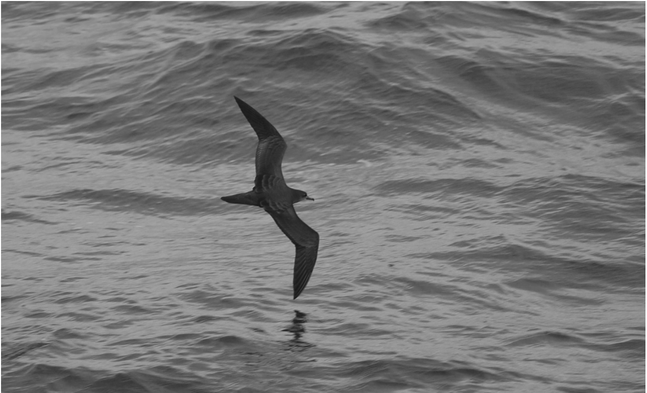
Figure 2. La taille de population du puffin pacifique atteint plus de 40 000 couples dans le seul « V » des Chesterfield (Tableau 7), ce qui fait de cet ensemble une IBA d'importance internationale pour la conservation de cette espèce. Sans être encore menacé d'extinction, le puffin pacifique est en déclin sur l'ensemble de son aire de distribution, victime de la destruction délibérée des oiseaux et des terriers, cible d'une surexploitation directe, proie des prédateurs introduits et prise accessoire de la pêche à la longue ligne (BirdLife International 2018a).