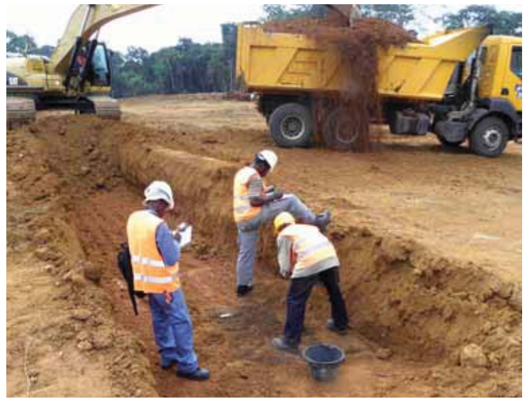
Fig. 2. Mpolongwé : découverte d'une structure en fosse (tache foncée) dans la tranchée.

La méthode de la lecture des paysages nous a permis de découvrir 52 sites sur cet axe routier long de 84 km au centre du pays. Les talus du tronçon ont été parcourus minutieusement