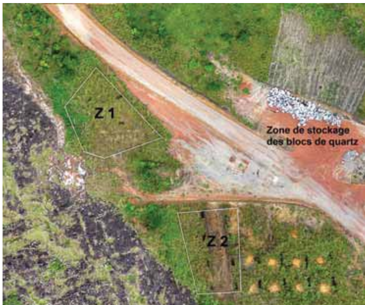
Fig. 4. Mikaka : vue aérienne par drone des zones Z1 et Z2 mises en protection ; les rectangles correspondent aux sondages réalisés lors de la phase de diagnostic (adapté de COMILOG par R. Oslisly).

Au cours de ces travaux, 50 structures archéologiques ont été découvertes, correspondant à 37 fosses, 12 niveaux archéologiques et une forge. Les vestiges matériels (392 kg) étaient constitués d'éclats de pierres taillées, de fragments de poteries, de faïence, de restes d'activité métallurgique (outils de fer), de perles et de verre.