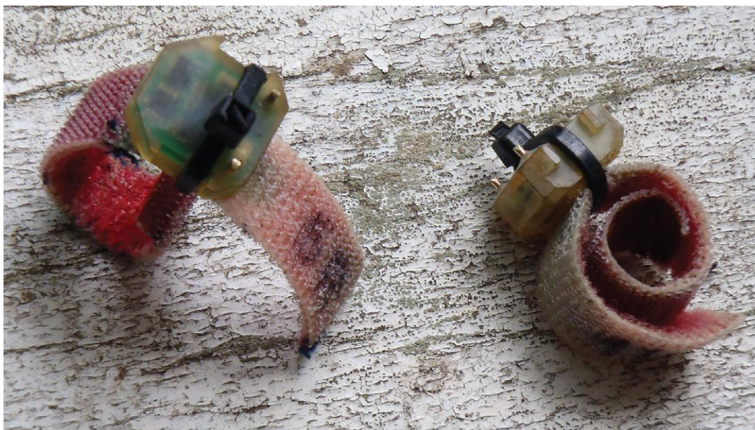
Fig. 1 Les deux premiers GLS récupérés lors de la mission, no. V1469-049 posé sur l'oiseau 6R (bague FL38336) et no. V1469-047 posé sur l'oiseau 1L (bague FL38305). Les bandes velcro n'accrochent quasiment plus : les instruments sont restés attachés aux pattes des oiseaux par le point de fil à coudre qui maintenait fermé le dernier tour de bande velcro. La surface de la résine s'est couverte d'une pellicule blanchâtre qui atténue nécessairement l'intensité de la lumière enregistrée.