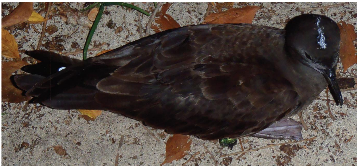
Fig. 2 Puffin fouquet Ardenna pacifica no. 6R (bague no. FL38336) quelques instants après la pose du GLS, ici visible sous son aile droite ; photo prise le 03 mars 2014.