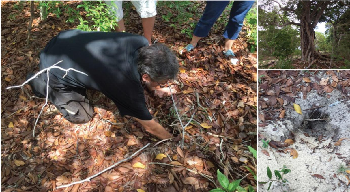
Fig. 5 Message posté par J.-M. Châtaigner (IRD) sur son compte Twitter, lors de son passage à la colonie de puffins de Temrock, dans la journée du 13 mars 2016. La photo du bas à droite montre un terrier actif, dont l'entrée est toutefois partiellement effondrée.