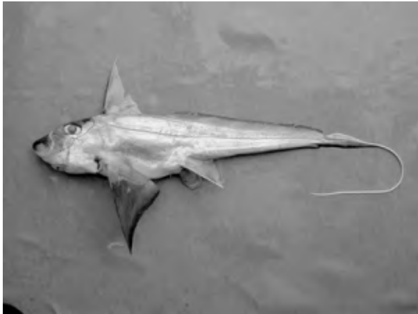
La chimère fantôme ( Chimaera phantasma ) a été chalutée par 500 mètres de fond.

Copyright © 2002 - Les Nouvelles-Calédoniennes - Tous droits réservés.