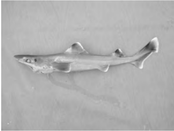
Les deux nouvelles espèces de requins découvertes par l'IRD. Il s'agit qu'un squalo-chagrin du genre Centrophorus , à gauche, et d'un requin-hâ du genre Hemitriakis , à droite.