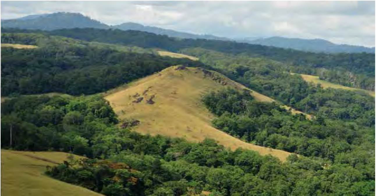
L'éperon rocheux d'Elarmekora dominant le paysage de forêts et de savanes dans la région d'Otoumbi.

près de 250 gravures. Si leur répartition sur les dalles rocheuses ne semble soumise à aucune règle, cinq zones de regroupement ont cependant pu être distinguées.