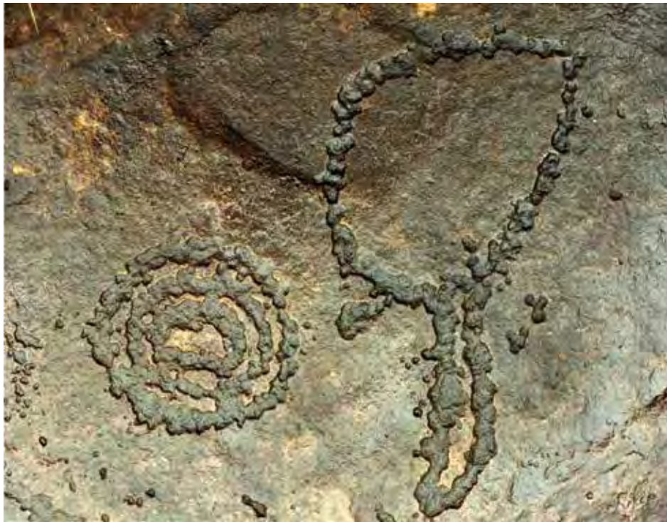
Epona – association d'un couteau de jet avec un cercle concentrique.

Selon la disposition des amoncellements rocheux qui s'échelonnent en étages, nous avons ainsi pu définir trois ensembles: l'ensemble A, le plus haut, compte 130 gravures, essentiellement des cercles simples et concentriques qui s'assemblent pour former de petites compositions ; l'ensemble B compte 130 représentations de cercles simples et concentriques, de rosaces et de petites chaînes de cercles; l'ensemble C, tout en bas, présente 170 figures de la famille des cercles, ainsi que des lézariformes et un couteau de jet.