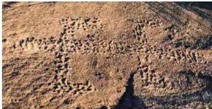
Elarmekora – Saisissante figure lézariforme qui est très fréquente dans l'iconographie africaine.

de petites cupules. Les piquetages sont homogènes mais certaines figures présentent des cupules de forme allongée et déjetée soit à droite, soit à gauche, indiquant l'utilisation d'une technique de percussion indirecte. Leur piquetage quasiment uniforme peut s'expliquer par l'utilisation d'une pointe de fer, presque inaltérable, alors que le piquetage obtenu avec un pic de pierre varie selon les transformations subies par l'instrument au cours du travail.