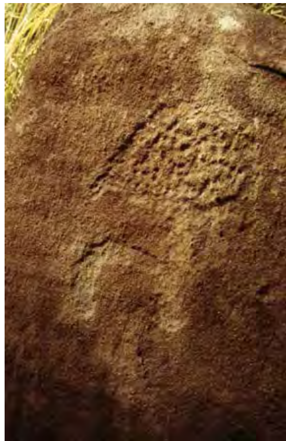
Le rocher 1 de Doda – représentation d'un couteau de jet avec le manche et l'ergot surmontés par une lame large en forme de goutte d'eau

Cette grande dalle rocheuse propose différentes figures gravées dont trois semblent relever du monde animalier. Ces figures zoomorphes sont gravées à plat, disposées comme des peaux tannées. On s'attachera à signaler le rôle important que jouent les peaux de civettes lors des cérémonies d'initiation au