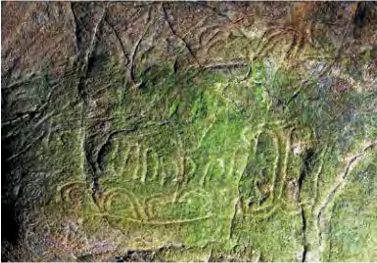
Grotte de Lipopa 1.

Cette cavité a été nommée en 1976 grotte de Lastoursville par Gérard Delorme, géologue de la COMILOG. Nous l'avons appelée lors de notre expédition de 2015 Lipopa du nom de la rivière qui la traverse, nom utilisé communément par les populations autochtones.