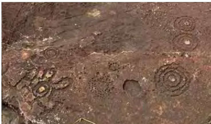
Elarmekora – ensemble comprenant des cercles concentriques, des piquetages circulaires et une superbe rosace à sept pétales.

La zone C, localisée au faite de l'éperon rocheux, présente une superbe composition de cercles concentriques associés à une rosace que deux représentations lézariformes semblent veiller.