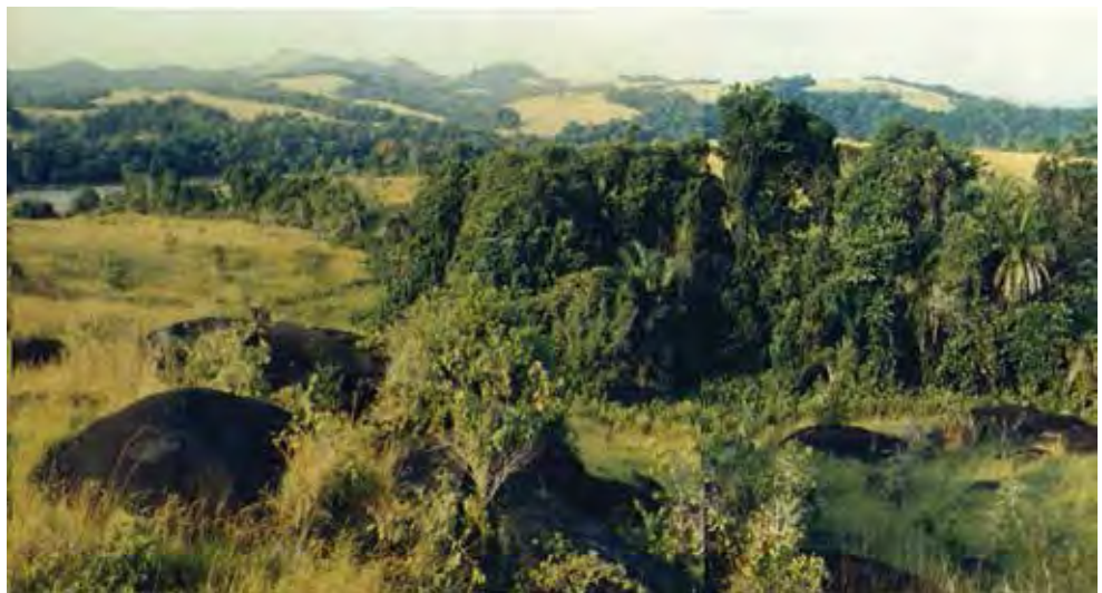
Kongo Boumba 1 – vue sur l'ensemble de rochers gravés dominant la vallée de l'Ogooué.

quartzitique déjà reconnue plus au sud, sur le site de Lindili.