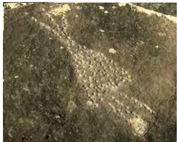
Elarmekora – figure triangulaire au piquetage accentué, munie de trois digitations disposées au sommet ainsi qu'à la base.

Sa dernière forme, la plus compliquée et la plus intéressante, montre de nouvelles courbes digitées et deux cupules disposées de part et d'autre du sommet.