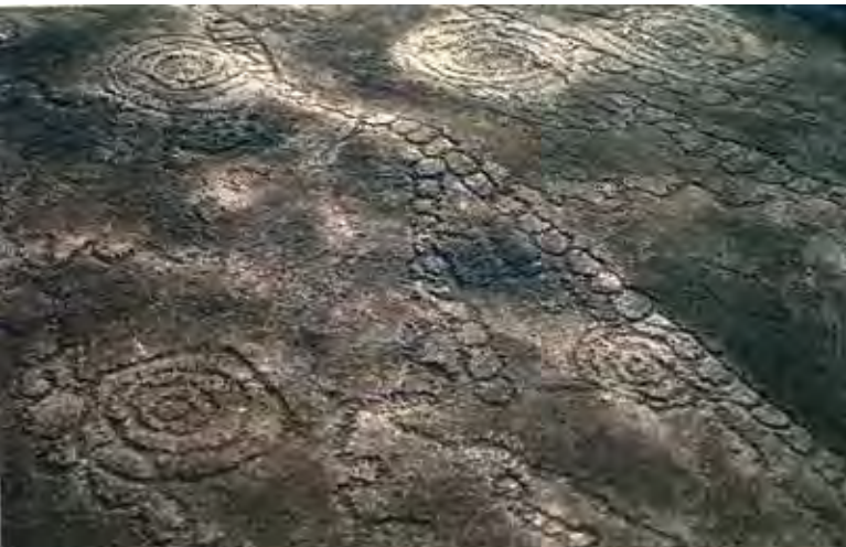
Kongo Boumba 1 – étrange composition de cercles concentriques, de chaînes de petits cercles et de traits divagants.

Le site de Kongo Boumba 7 consiste en deux énormes rochers dont les surfaces portent chacune deux compositions très différentes ; sur l'une ce sont essentiellement des cercles simples qui entourent deux cercles concentriques tandis que sur l'autre, plus complexe, on trouve cinq demi-cercles concentriques entourés de chaînes de cercles et de traits divagants.