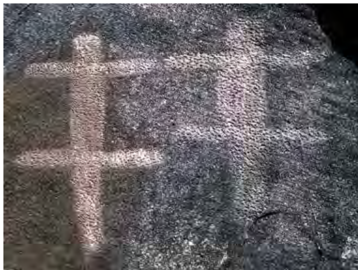
Rocher d'Ibombi – représentations gravées relevant du monde animal.

Terminant le circuit rupestre de Doda, nous découvrons un imposant rocher de forme tabulaire recouvert d'une multitude de gravures très bien exécutées dont de remarquables figures zoomorphes, des couteaux de jets, des cercles simples et concentriques. La paroi nord montre une étonnante composition de cinq figures de lézards. La surface supérieure supporte un ensemble de figures linéaires profondément gravées comme des cercles simples ou concentriques, des traits divagants jouxtant des piquetages.