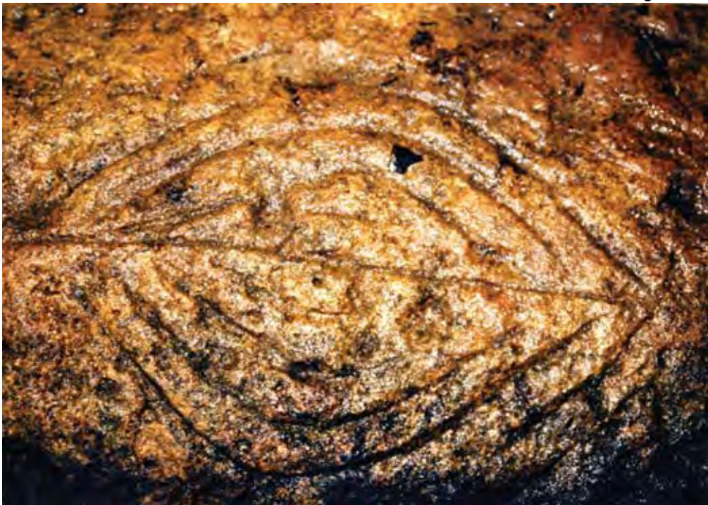
Kaya Kaya – Image vulvaire coupée d'une ligne soigneusement incisée.

L'art rupestre n'est évidemment pas directement datable mais certains paramètres nous permettent d'estimer son âge et de le rattacher à un contexte culturel. L'analyse des procédés techniques d'exécution tend à confirmer que les gravures rupestres de la vallée de l'Ogooué ont été exécutées à l'aide d'instruments de fer, ce