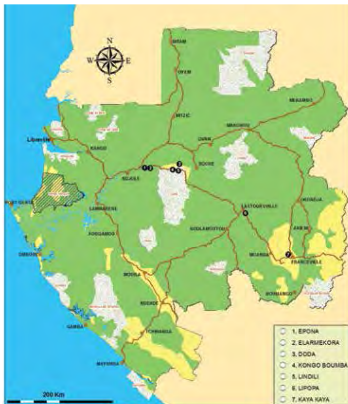
Carte des sites rupestres de la vallée de l'Ogooué.

Découvert en 1987, Elarmékora a été le premier site rupestre connu. Cet éperon rocheux culminant au-dessus du fleuve témoigne d'un art étonnant de la figuration graphique, avec