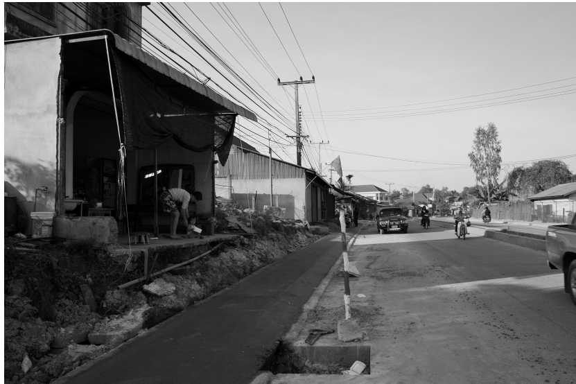
Figure 3 : Les travaux d'élargissement de la rue Phontong

Les opérations d'élargissement des routes ont, quant à elles, mobilisé de nombreux acteurs étrangers, tant pour leur financement que pour leur réalisation. À partir du Stade National, la route nationale n° 13 en direction de Paksé a été élargie sur plus de 20 km pour un coût dépassant les 50 millions de dollars étatsuniens. Pour cette opération, le gouvernement laotien a obtenu un prêt de la banque d'État chinoise Eximbank. Le Yunnan Construction Engineering Group, déjà lié à la construction du Stade National, a effectué les travaux de voirie. L'élargissement d'une autre section de 4,5 km de la route nationale n° 13, à l'ouest du stade en direction du centre historique, a été financé par la Corée du Sud par un prêt de 4 millions de dollars étatsuniens. Cette opération a associé une compagnie de travaux publics sud-coréenne (Hanbaek-KCI) à un bureau de consultants sud-coréen (Isan), en partenariat avec un bureau local (Laos Transport Engineering Consultant). Une autre section routière de plus de 9 km, l'axe Phontong reliant l'Université nationale au centre de la capitale, a été élargie par une compagnie de construction chinoise (Qin Huang Dao Tong Lian Group). Ce chantier, dont le coût était estimé à environ 11 millions de dollars étatsuniens, fut financé par le gouvernement laotien.