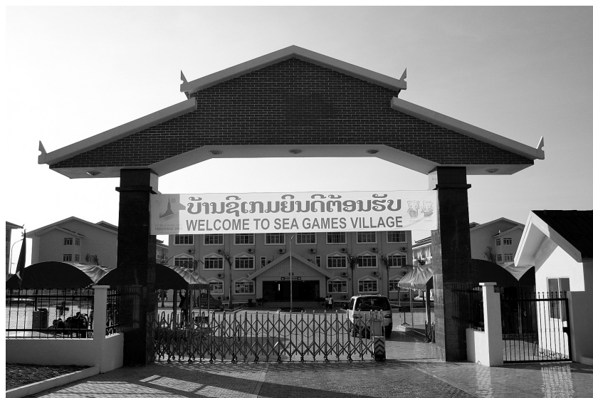
Figure 2 : L'entrée principale du village des athlètes financé par le Vietnam

L'organisation des Jeux aurait pu être considérée par les autorités comme une occasion de produire une centralité, faisant jusqu'alors défaut dans la capitale. Mais la distribution à l'échelle de la ville des équipements sportifs ne permet pas de penser qu'une stratégie particulière ait été élaborée. Les épreuves sportives se sont en effet déroulées sur trois sites éloignés les uns des autres : le Stade national et l'Université nationale sont respectivement situés à 16 et 9 km du centre historique. Si l'accueil de l'évènement sportif a bien produit de nouvelles polarités, notamment en périphérie nord-est de la ville, avec le renforcement du pôle universitaire, il n'a en revanche pas suscité une nouvelle échelle de centralité pour structurer le développement urbain, ni même entraîné la construction de nouveaux quartiers d'habitation ou d'activités. L'effet de l'accueil des Jeux sur l'organisation de la ville paraît à ce titre limité.