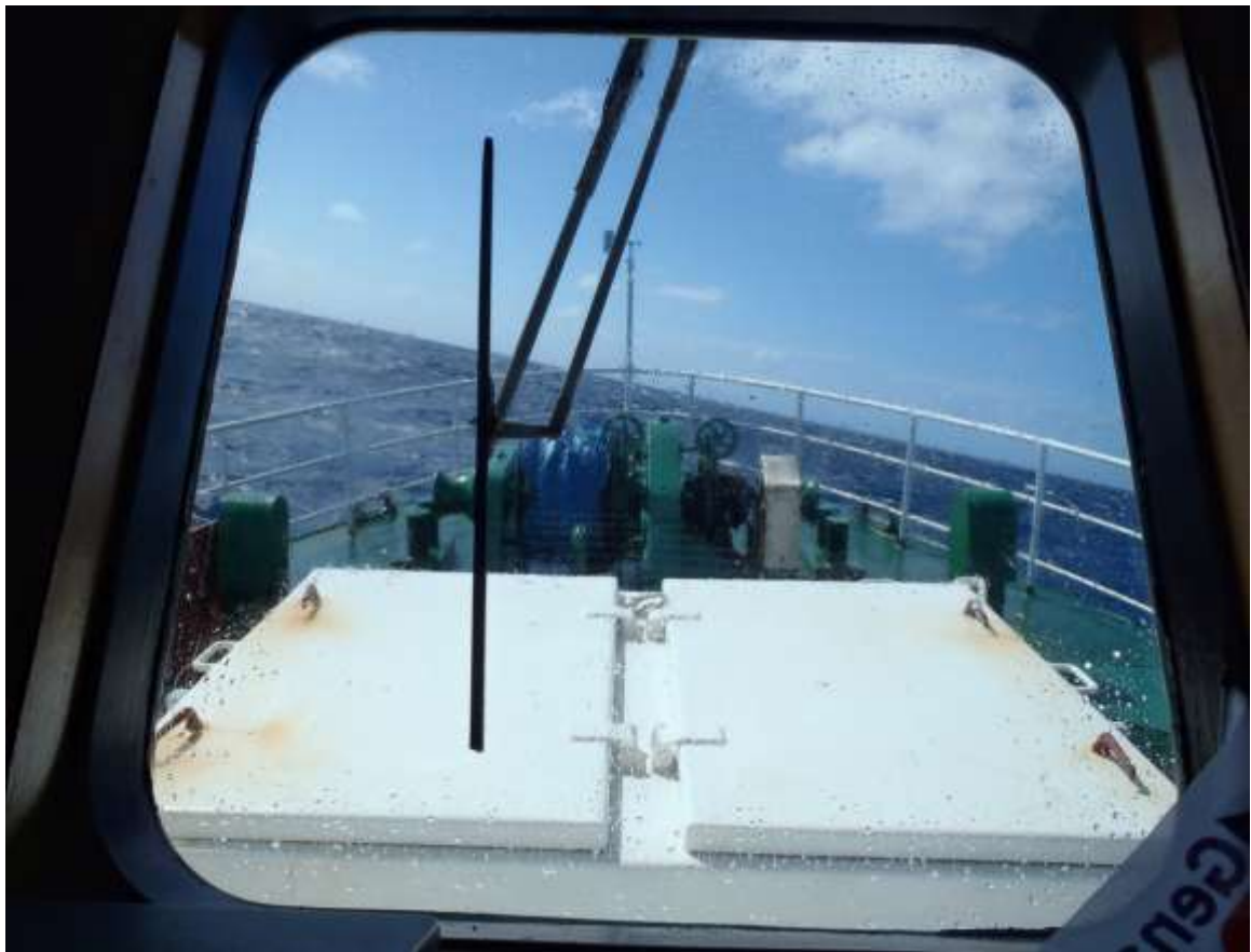
Le pont avant est un peu humide ce matin

Il semble que les concentrations d'oiseaux marins que nous avons observées lors des radiales coïncident avec des pics d'activité biologique tels que le traitement des données ADCP permet de les détecter. Les radiales, si elles sont trop courtes pour échantillonner correctement la zone prospectée par les fous à pieds rouges, serviront au moins à tester cette hypothèse.