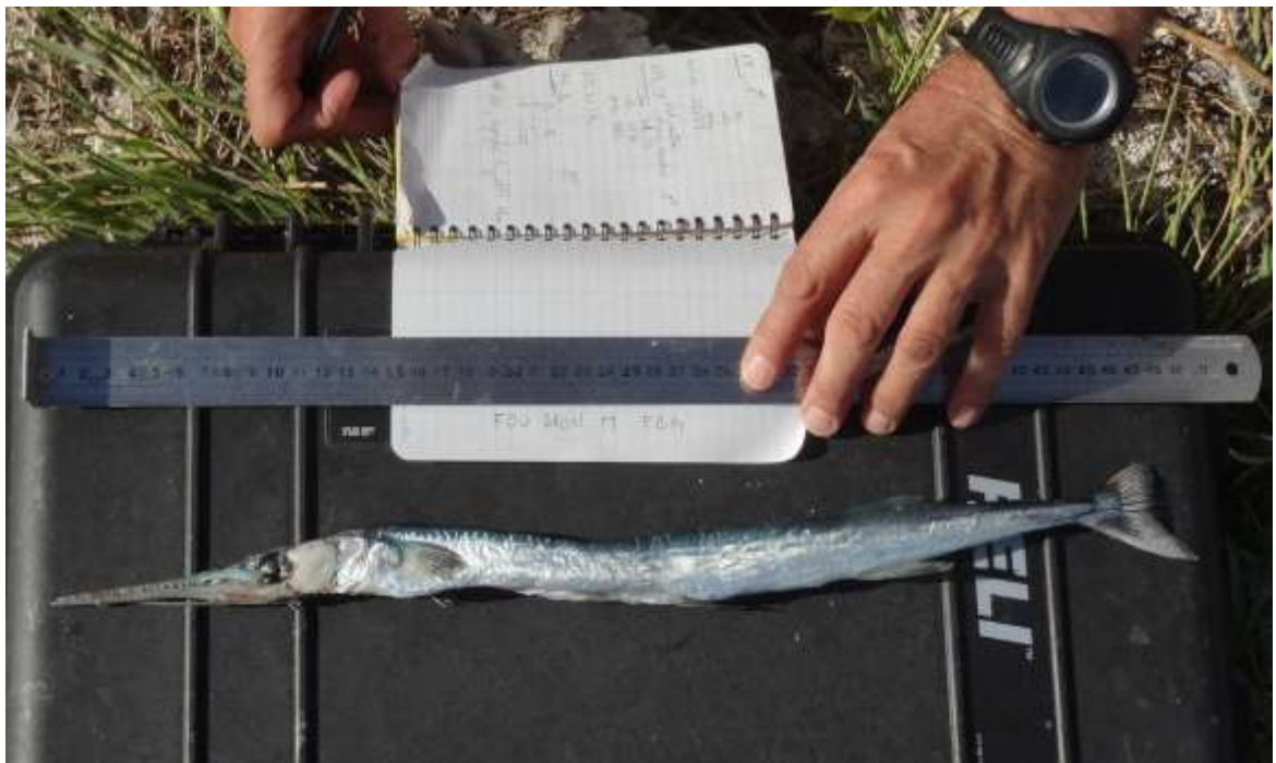
Un fou brun régurgite une aiguillette-crocodile qu'il avait à peine commencé à digérer. Il saute un repas qui s'annonçait copieux (© IRD / J.-M. Boré).