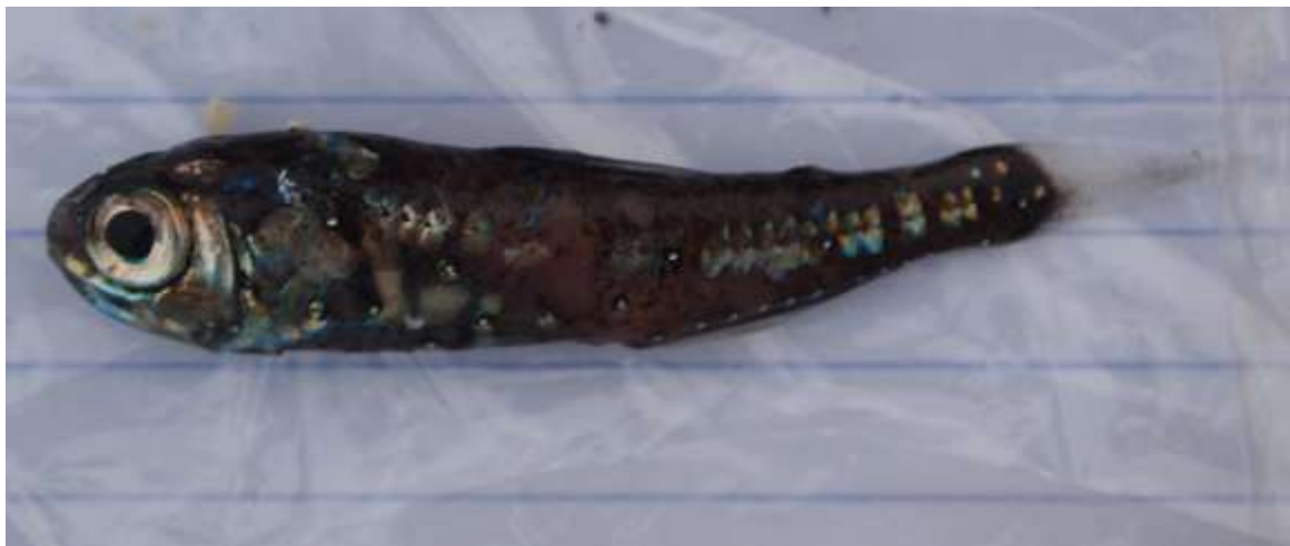
Un mystérieux poisson Myctophidae trouvé quasiment intact sur le sable de la plage de l'Île Longue.