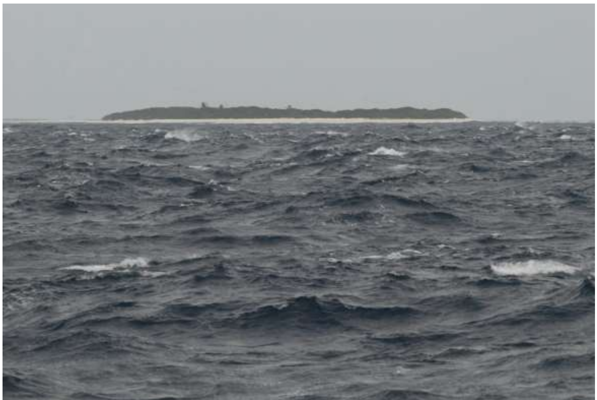
Aux abords de la passe de l'île Longue.