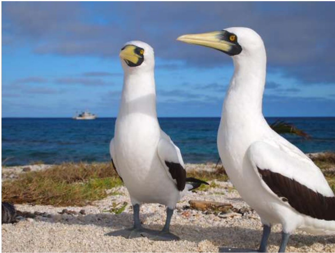
Ilots du Mouillage : deux fous masqués prennent la pose devant le photographe, qui a choisi l' Alis au mouillage comme arrière-plan.

Pour la première fois depuis le tout début de la mission, le vent est tombé et le lagon est calme. Que n'a-t-il pas fait beau plus tôt ! Le programme en eût été moins perturbé. D'un autre côté, les oiseaux sont probablement moins actifs par beau temps que par temps venteux : nous n'aurions peut-être pas pu collecter autant de données s'il n'y avait eu le vent pour les emmener loin au large.