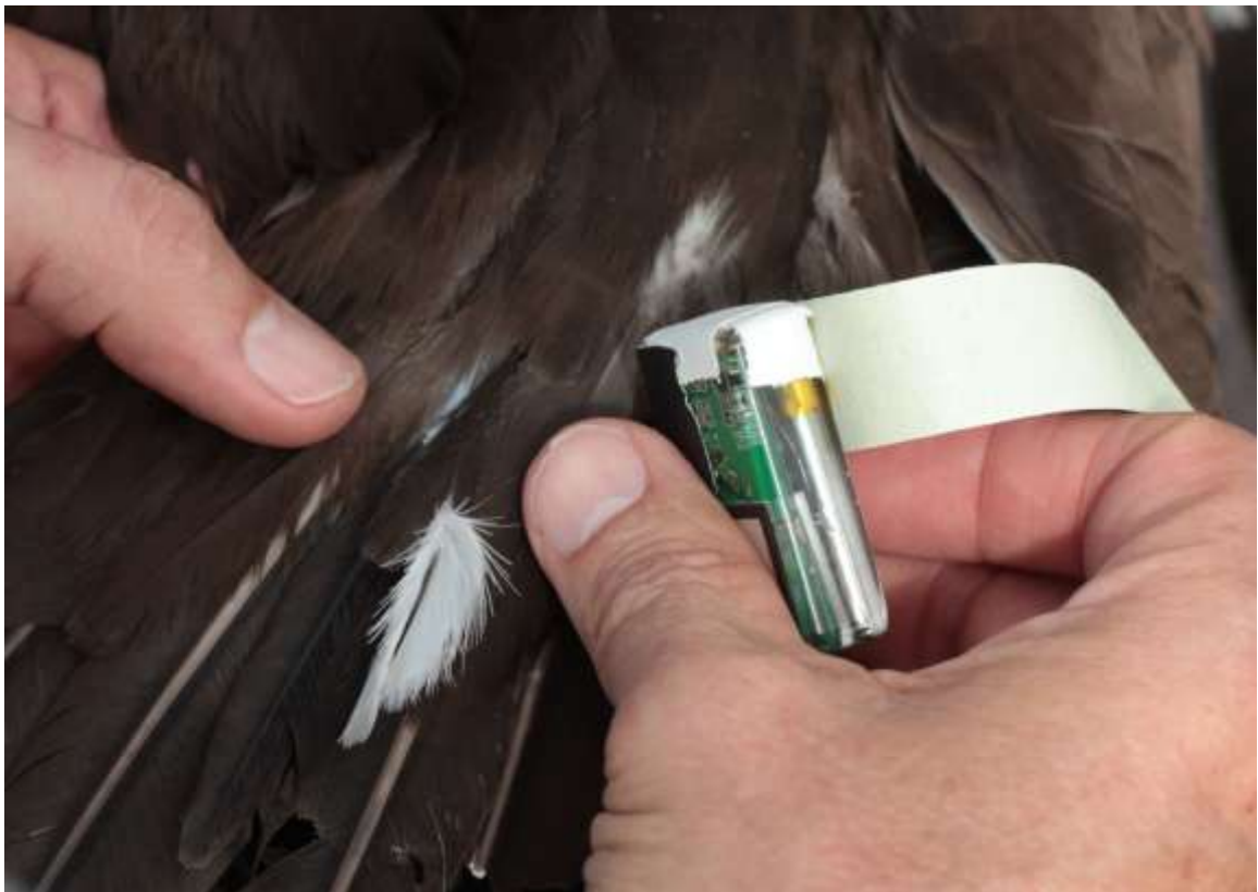
Pose d'un capteur GPS sous les plumes de la queue d'un fou brun.