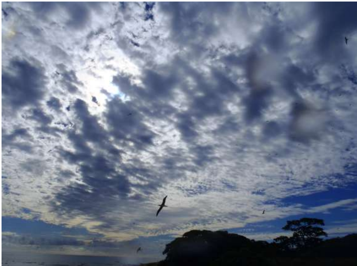
Îlots du Mouillage, après-midi du 05 juin 2012 : une journée inoubliable

Néanmoins, le temps est superbe. Nous savourons les derniers instants de cette belle journée aux îles Chesterfield. Dans une heure, l' Alis lèvera l'ancre et nous mettrons le cap vers Nouméa.