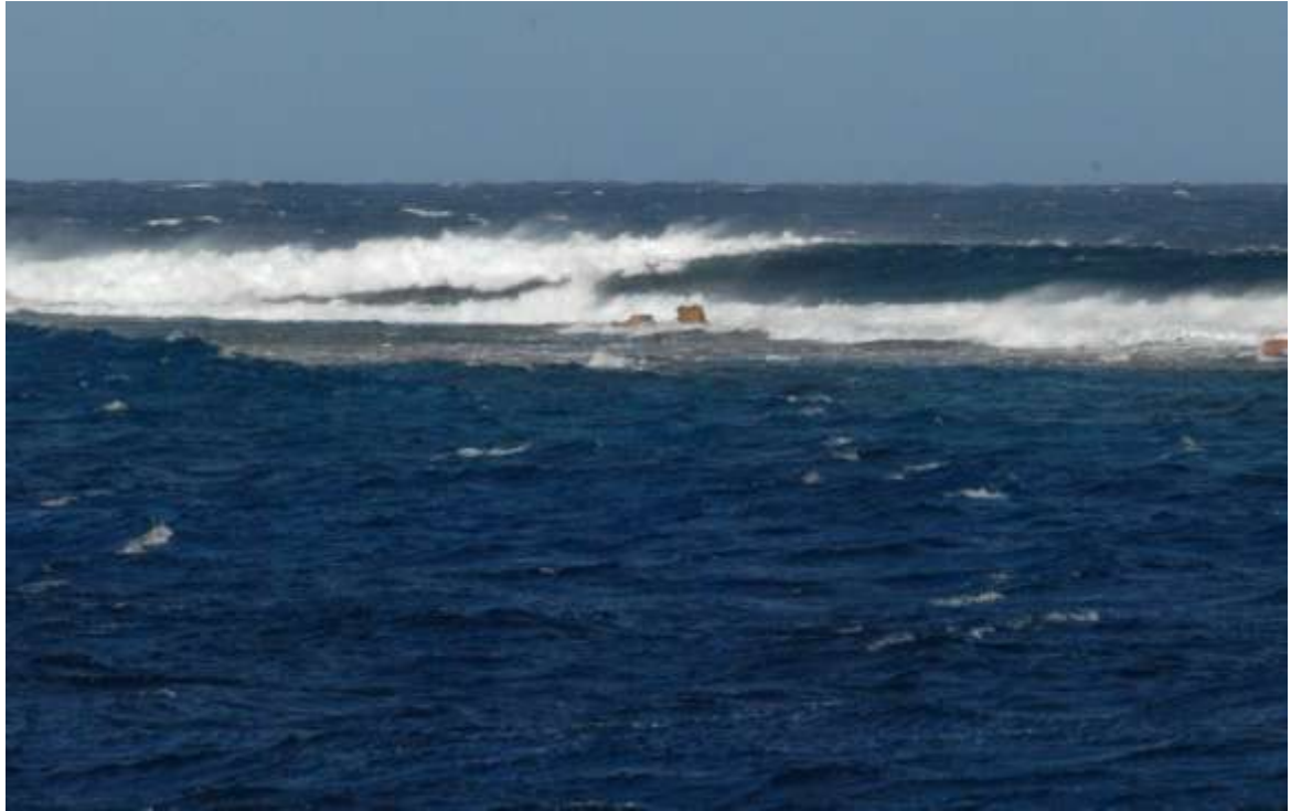
La houle déferle sur le platier de la pointe nord de l'île Longue.