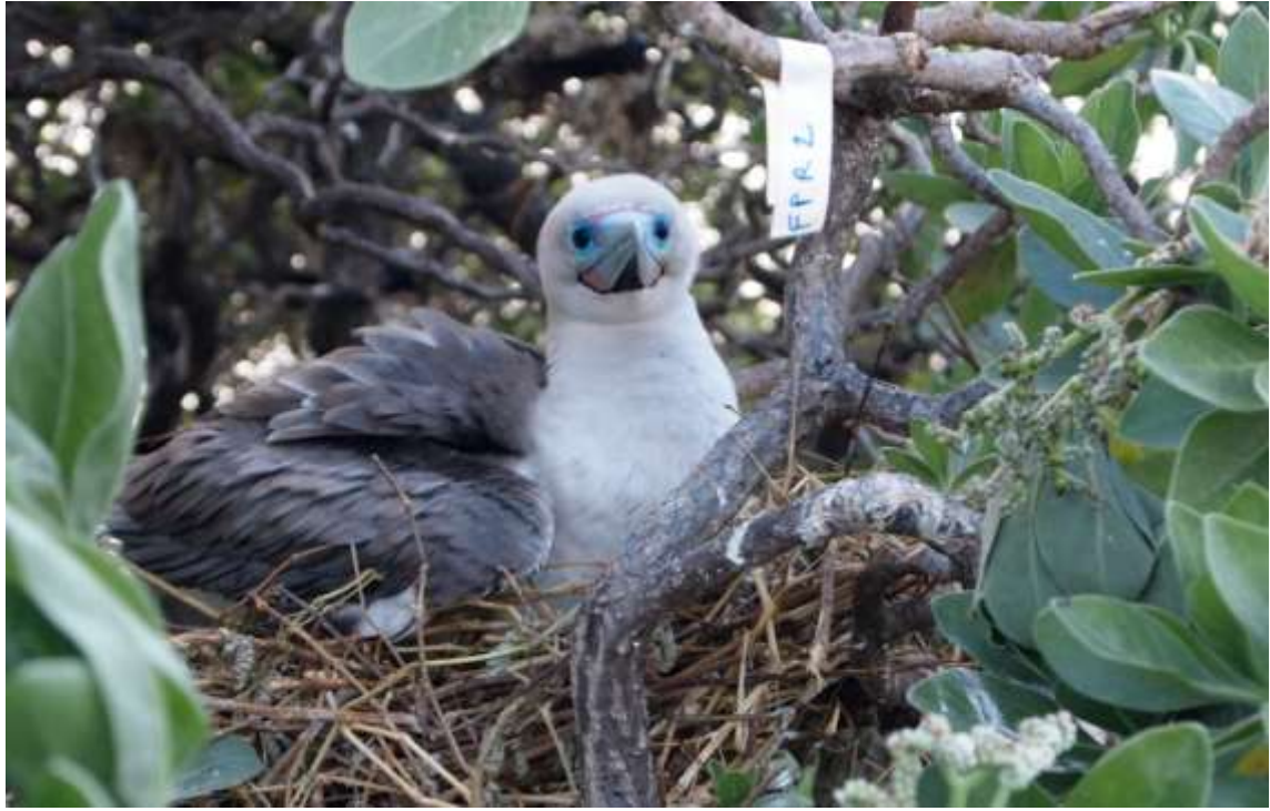
Sur l'Île Longue, le nid du fou à pieds rouges n°FPR2.