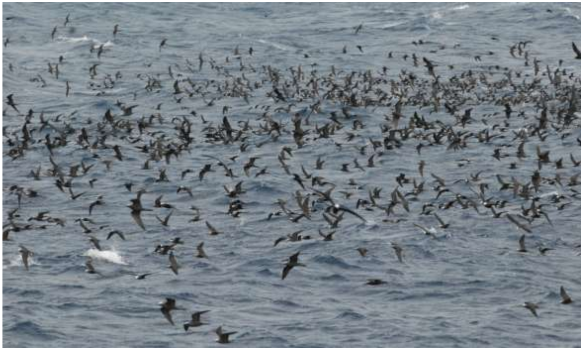
Noddis noirs en action de pêche.