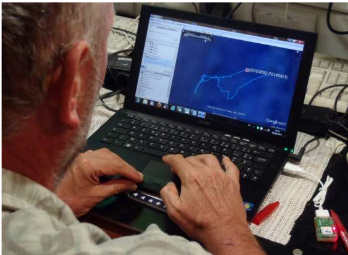
Les données GPS révèlent le trajet réalisé par un fou à pieds rouges, l'un des sept individus récupérés sur l'île Longue aujourd'hui.