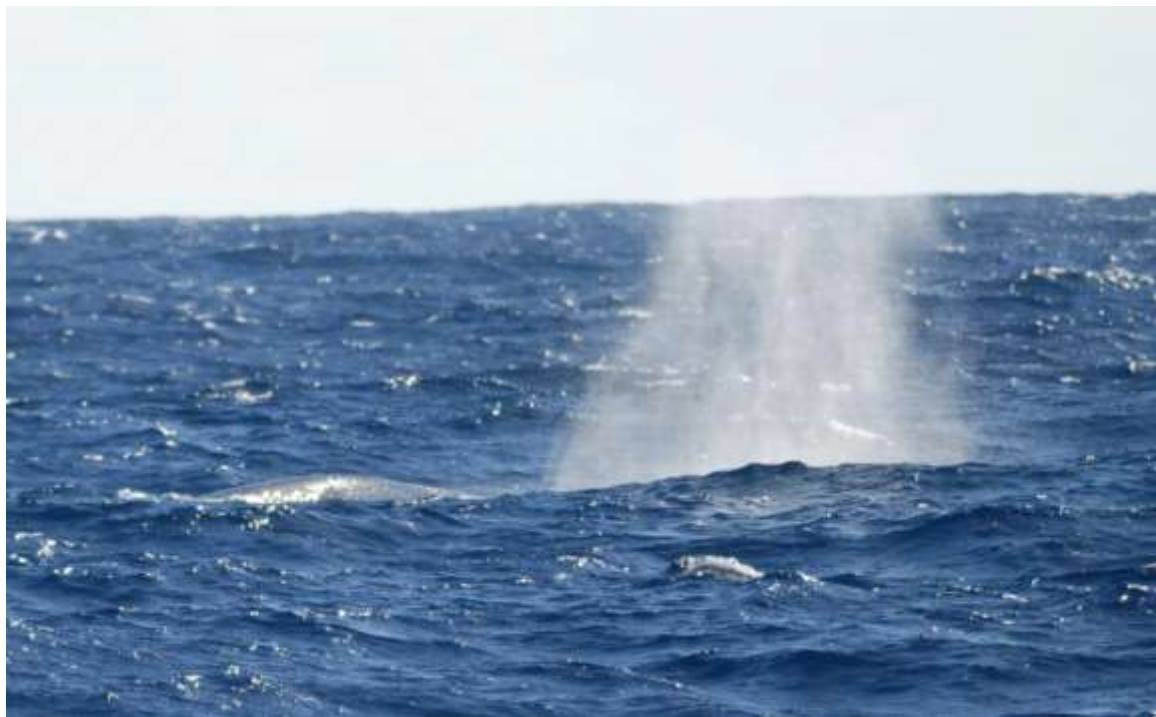
Baleine bleue et son baleineau, rencontrés à environ 30 milles au large de Koné, le 07 juin 2012

Les deux baleines finissent par se perdre dans le soleil et l' Alis reprend son cap. S'agissait-il vraiment de baleines à bosse ? Julien pense que non. Je jette un coup d'œil à mon Nikon : j'ai fait une petite série de photos au jugé et avec un peu de chance il y aura des indices permettant de déterminer l'espèce. En effet, une des photos montre un dos gris moucheté de taches pâles, une autre un aileron minuscule à l'arrière du dos... je réalise que nous venons de passer quelques minutes privilégiées avec une baleine bleue et son petit.