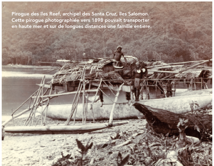
Pirogue des îles Reef, archipel des Santa Cruz, îles Salomon. Cette pirogue photographée vers 1898 pouvait transporter en haute mer et sur de longues distances une famille entière.

On sait aujourd'hui que l'histoire du peuplement des îles du Pacifique est plus complexe et caractérisée par un brassage permanent au sein de réseaux d'échanges étendus avec, à certaines époques, des influx asiatiques et des contacts avec le monde amérindien.