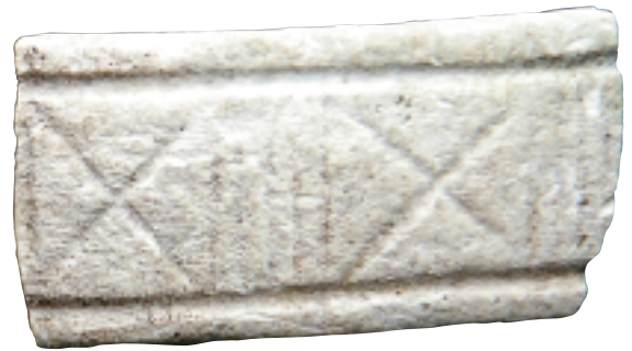
Les peuples Lapita partagent avec leurs contemporains d'Asie du Sud-Est insulaire une large variété d'objets de parure en coquillage, bracelets ou pendentifs.

Une île, Taïwan, occupe une place particulière dans le débat sur l'émergence du monde Lapita. Pour les linguistes, Taïwan a souvent été décrit comme le berceau des langues austronésiennes. Par ailleurs, les sociétés néolithiques de l'est de Taïwan ont eu des relations d'échanges avec le nord des îles Philippines à une période et dans un