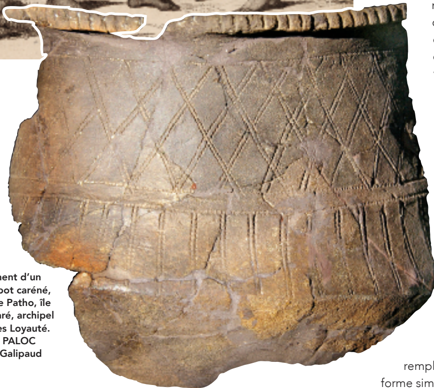
Fragment d’un petit pot caréné, site de Patho, île de Maré, archipel des îles Loyauté.

Il faut quinze jours avec une grande pirogue pour traverser l’archipel des Salomon, mais il y a au moins un siècle de différence entre le plus ancien site dans le Bismarck et les sites des îles Santa Cruz, au sud de l’archipel des îles Salomon. Deux à trois siècles plus tard, la poterie décorée Lapita a disparu des sites de l’Océanie lointaine et est remplacée par une poterie non décorée de forme simple.