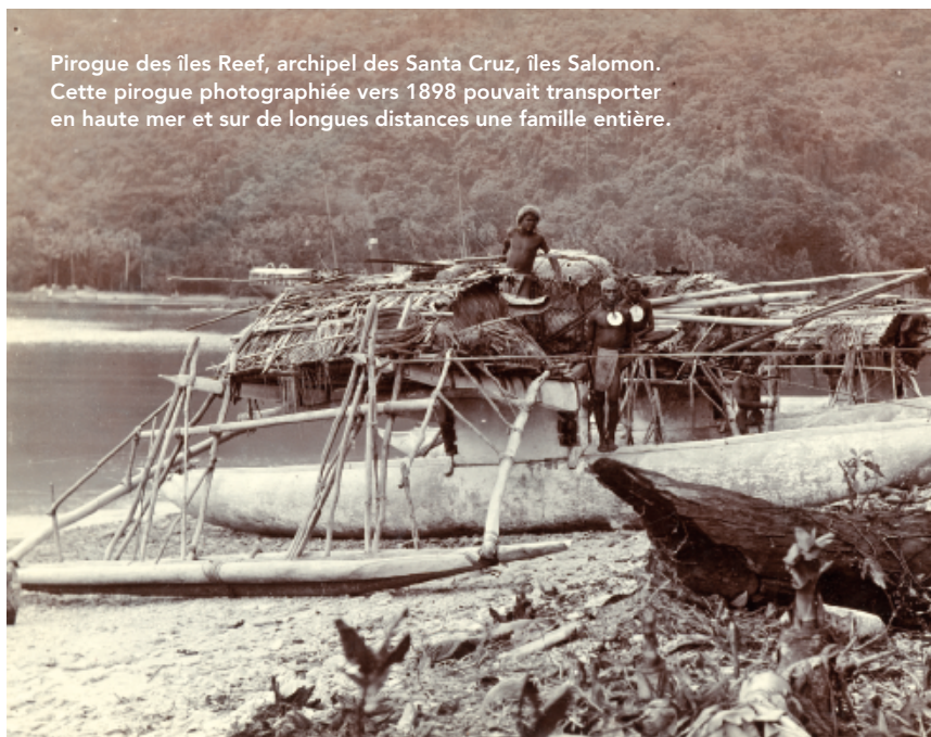
Pirogue des îles Reef, archipel des Santa Cruz, îles Salomon. Cette pirogue photographée vers 1898 pouvait transporter en haute mer et sur de longues distances une famille entière.

On sait aujourd'hui que l'histoire du peuplement des îles du Pacifique est plus complexe et caractérisée par un brassage permanent au sein de réseaux d'échanges étendus avec, à certaines époques, des influx asiatiques et des contacts avec le monde amérindien.