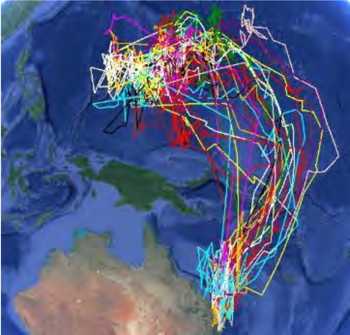
Fig. 1 Trajets et lieux d'hivernage des puffins fouquets de la colonie de Heron Island, basés sur les positions journalières de 15 individus équipés de géolocaliseurs GLS déployés d'avril 2012 à mars 2013 (B.C. et F. McDuie, observations non publiées).