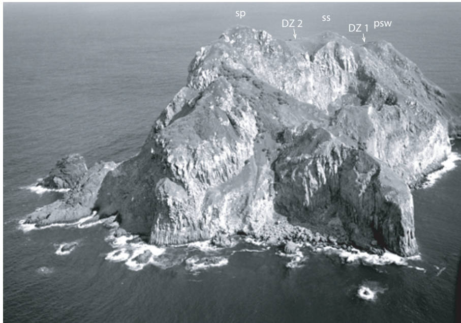
FIG. 1. - Vue de l'extrémité NW de l'île Hunter (12 décembre 2004, ~15:30). Les trois pics sont visibles le long de la ligne de crête : le sommet principal du volcan ( sp ), puis le second sommet ( ss ), puis le pic SW ( psw ). La DZ ( DZ 1 ) est située dans le creux entre le pic secondaire et le pic SW. La zone des "trois bosquets" située dans le creux entre le sommet principal et le pic secondaire peut également être utilisée comme DZ ( DZ 2 ) pour l'atterrissage des hélicoptères. La falaise verticale à l'aplomb du sommet principal et du pic secondaire forme la paroi est du cratère W. Le cratère E n'est pas visible sur cette photographie