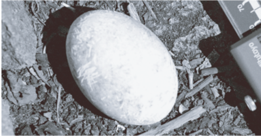
FIG. 6. - Traces d'incisives visibles sur un oeuf de fou brun ( Sula leucogaster ). Ile Hunter, à proximité de la DZ 2, 13 décembre 2004