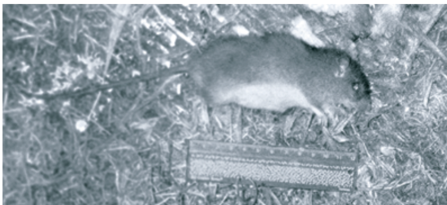
FIG. 4. - Rat ( Rattus exulans ) capturé sur l'île Hunter, à proximité de la DZ 1, le 12 décembre 2004