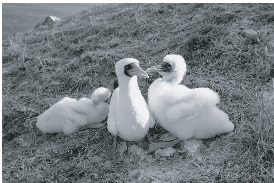
FIG. 9. - Adulte de fou masqué ( Sula dactylatra ) avec deux poussins. Sommet de l'île Matthew, 13 décembre 2004