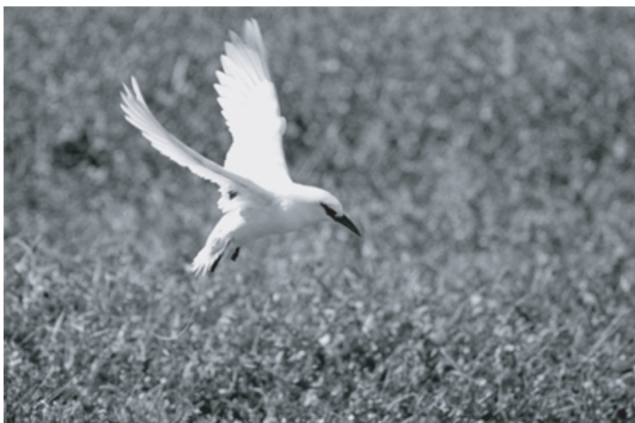
FIG. 5. - Phaéton à brins rouges ( Phaethon rubricauda ) en vol stationnaire (parade ?) au-dessus de son nid dans la végétation basse des hauteurs de l'île Hunter, 13 décembre 2004