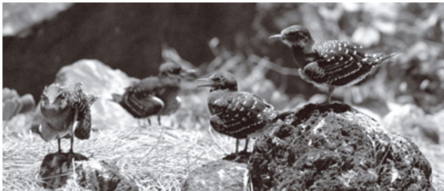
FIG. 8. - Poussins de sterne fuligineuse ( Sterna fuscata ) groupés dans la zone des éboulis du volcan principal, île Matthew, 13 décembre 2004