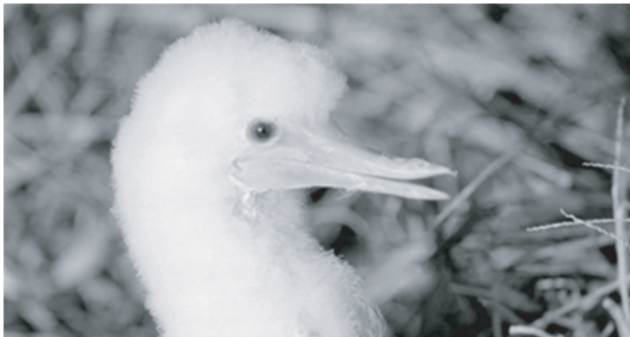
FIG. 3. - Poussin de fou brun ( Sula leucogaster ) présentant une difformité du bec. DZ 1, Ile Hunter, 12 décembre 2004