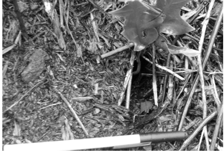
FIG. 6. - Entrée d'un terrier de petit pétrel (?), creusé dans la tourbe sous les fougères. Pentes du Puits, flanc est du volcan principal, île Matthew (17 avril 2008). Echelle : 15 cm.