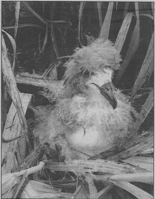
Ce poussin de pétrel à ailes noires est la preuve que cette espèce menacée se reproduit sur l'îlot Matthew.