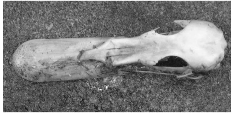
FIG. 7. - Crâne d'un cadavre d'Anatidae découvert sur l'île Matthew (17 avril 2008). Longueur, de l'extrémité du bec à l'occiput : 108 mm.