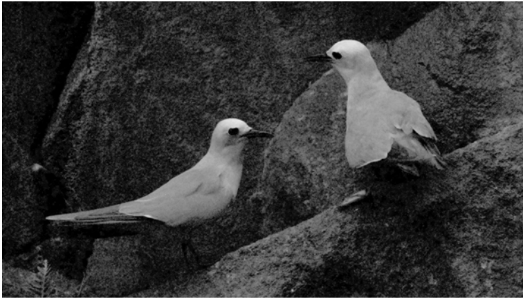
FIG. 5. - Couple de noddis gris Anous albigitta au repos dans les éboulis à l'entrée du Puits, flanc est du volcan principal, île Matthew (17 avril 2008).