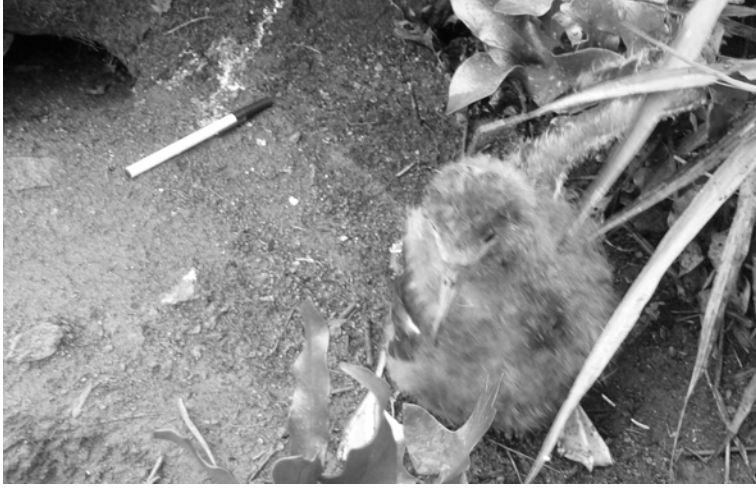
FIG. 4. - Poussin de puffin du Pacifique Ardenna pacifica , capturé au fond de son terrier découvert sur le flanc sud-est du volcan principal, île Matthew (17 avril 2008).