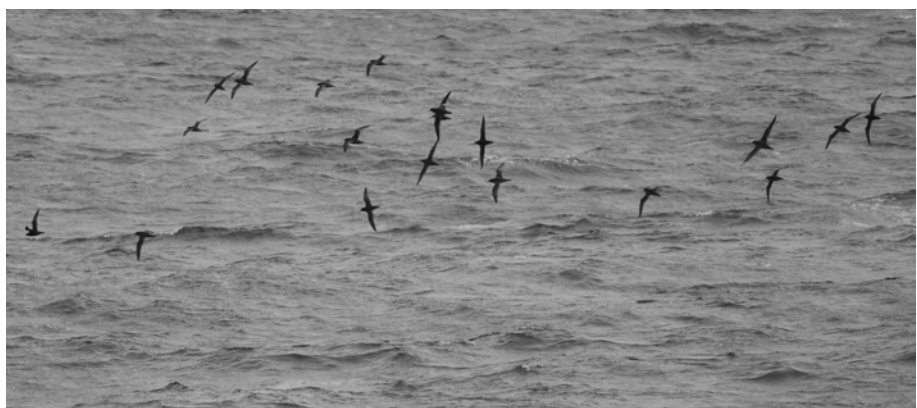
FIG. 10. - Puffins à bec grêle Ardenna tenuirostris observés en migration en direction du nord-est (par 22°24.3' S ; 168°08.1' E, le 16 avril 2008, 17:24)