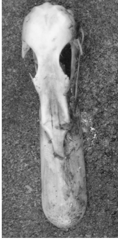
FIG. 7. - Crâne d'un cadavre d'Anatidae découvert sur l'île Matthew (17 avril 2008). Longueur, de l'extrémité du bec à l'occiput : 108 mm