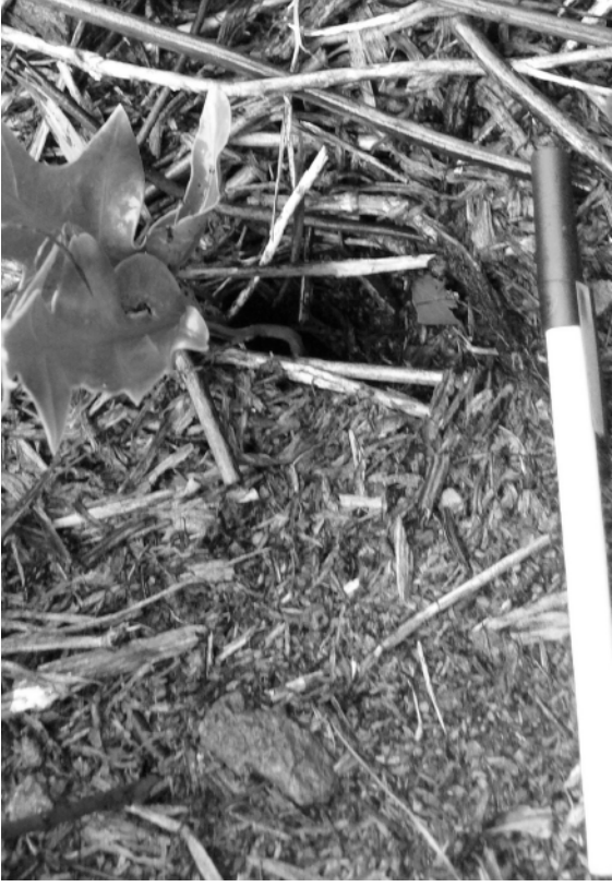
FIG. 6. - Entrée d'un terrier de petit pétrel (?), creusé dans la tourbe sous les fougères. Pentes du Puits, flanc est du volcan principal, île Matthew (17 avril 2008). Echelle : 15 cm