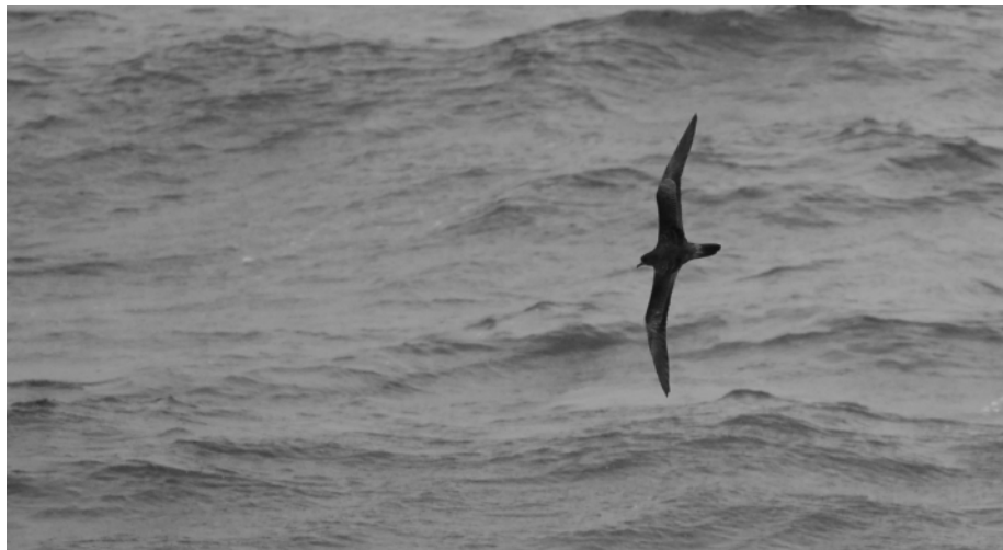
FIG. 9. - Puffin fouquet ( Puffinus pacificus ) dans le bassin des Loyauté (22°19.0' S ; 167°21.5' E) le 16 avril 2008, 13:55