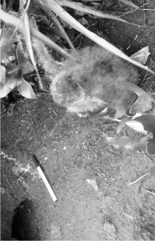
FIG. 4. - Poussin de puffin pacifique ( Puffinus pacificus ), capturé au fond de son terrier découvert sur le flanc sud-est du volcan principal, île Matthew (17 avril 2008)