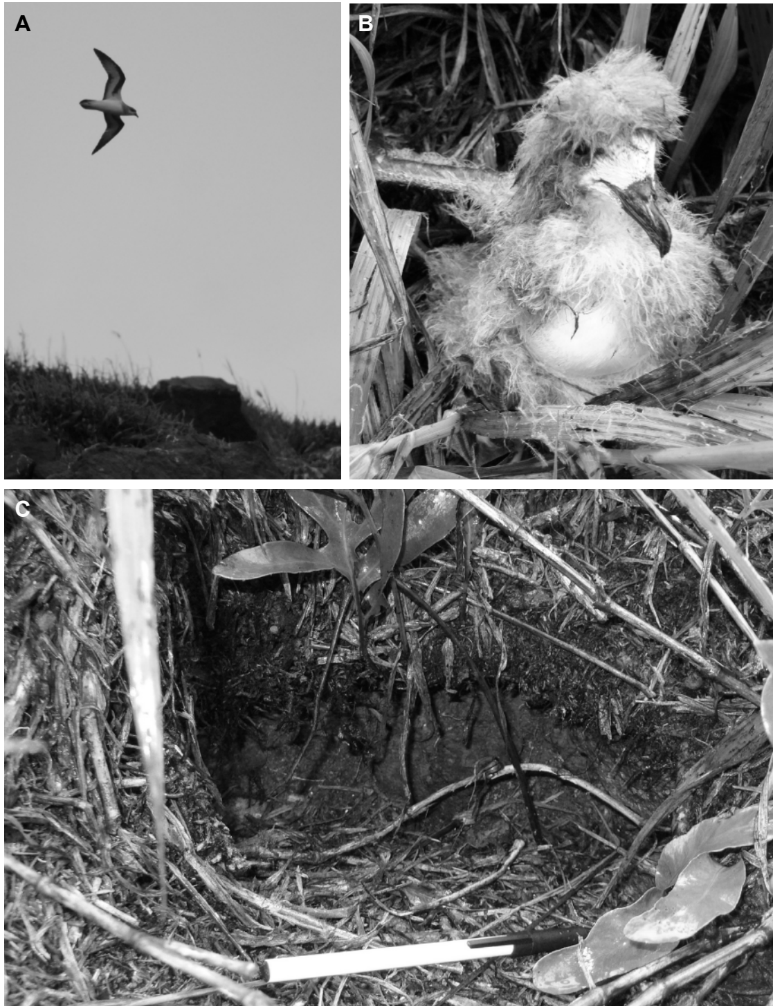
FIG. 3. - Pétrel à ailes noires ( Pterodroma nigripennis ) sur l'île Matthew (17 avril 2008). A. Individu adulte survolant sa colonie à mi-hauteur sur le flanc est du volcan principal. B. Poussin proche de l'envol, capturé au fond de son terrier dans la colonie située dans la faille du Puits, flanc est du volcan principal. C. Entrée de terrier, creusé dans la tourbe sous un tapis de fougères, flanc est ; échelle : 15 cm