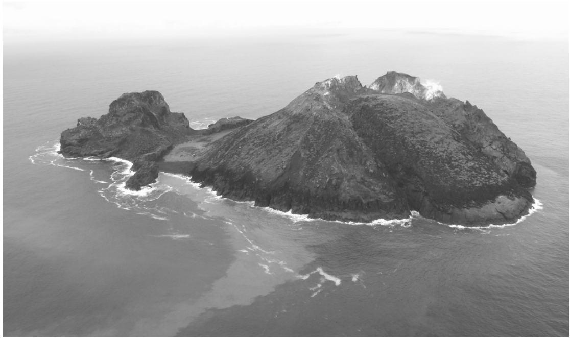
FIG. 1. - Approche de l'île Matthew par le nord, 17 avril 2008