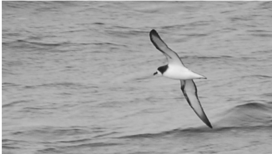
FIG. 8. - Pétrel de Gould ( Pterodroma leucoptera ) observé au large de la passe de la Havannah (22°18.7' S ; 167°15.8' E) le 16 avril 2008, 13:20