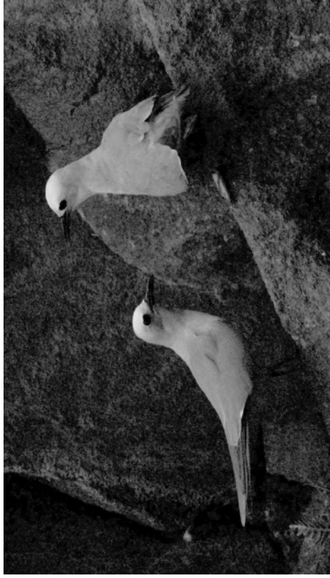
FIG. 5. - Couple de noddis gris ( Procelsterna albivitta ) au repos dans les éboulis à l'entrée du Puits, flanc est du volcan principal, île Matthew (17 avril 2008)