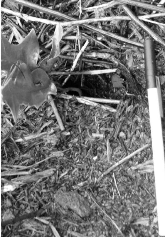
FIG. 6. - Entrée d'un terrier de petit pétrel (?), creusé dans la tourbe sous les fougères. Pentes du Puits, flanc est du volcan principal, île Matthew (17 avril 2008). Echelle : 15 cm