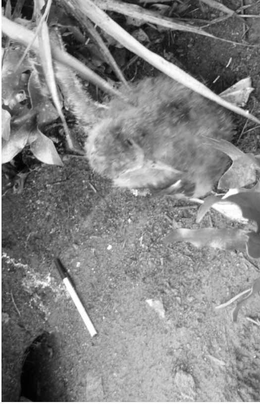
FIG. 4. - Poussin de puffin pacifique ( Puffinus pacificus ), capturé au fond de son terrier découvert sur le flanc sud-est du volcan principal, île Matthew (17 avril 2008)