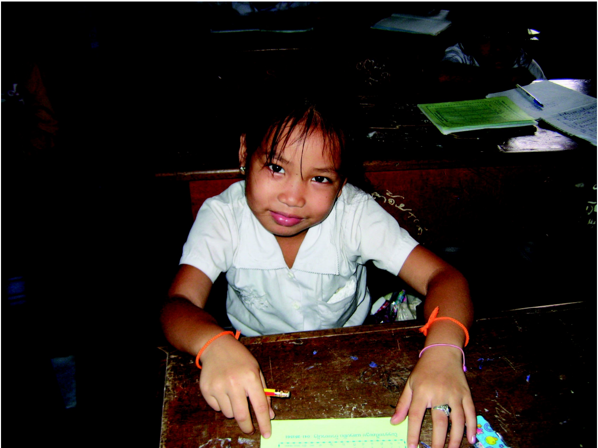
A l'école