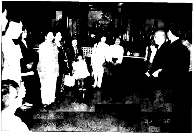
Pèlerinage au temple d'adeptes venus de Thaïlande Premier niveau : divinités Milefo (au centre)

Les trois divinités Guanyin , Mazu et Wusheng laomu , sont des figures féminines protectrices et pleines de compassion. A ce niveau, aucune différence dans les pratiques entre un temple Yiguan dao et un temple local n'est visible. Les particularités se dessinent en gravissant les étages : la verticalité des étages reflète le degré de compréhension de la religion. Les deux derniers sont réservés aux initiés : ils sont voués à Confucius, Lao-Tseu ou Mencius, et au bouddha Milefo . Cette configuration spatiale reflète la hiérarchie des divinités et des doctrines philosophiques dans les représentations men-