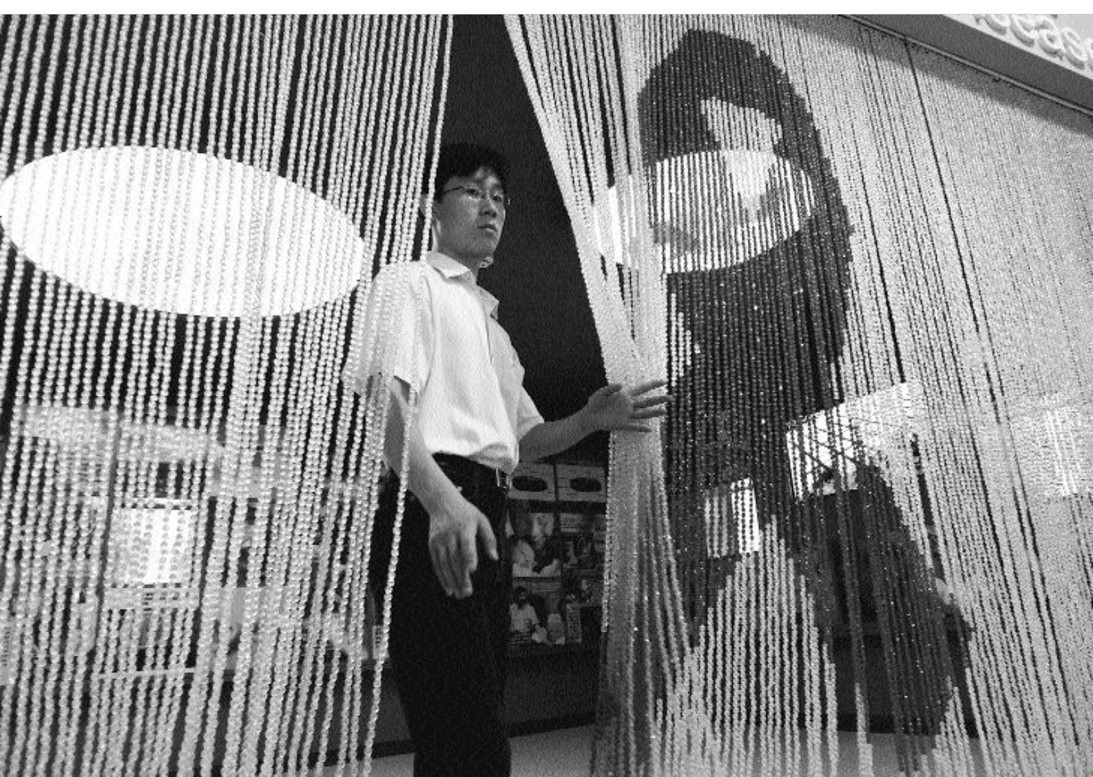
Exposition sur le Sida à Pékin. Les lacunes en matière d'éducation sexuelle sont désormais officiellement reconnues

La ligne d'action dominante consiste à préconiser le maintien des pratiques traditionnelles en matière de santé de la reproduction si elles sont compatibles avec les recommandations globalisées émanant des organismes internationaux, et de rejeter celles qui ont un impact négatif et qui représentent des obstacles à l'application des programmes. Les termes utilisés pour désigner les pratiques et les acteurs évoquent la période maoïste et l'adhésion à un schéma évolutionniste pour caractériser les populations minoritaires, conforme à celui qui était répandu en Union soviétique ; les pratiques de ces populations sont « primitives », « dépassées », « pas modernes », etc. Ces aspects de l'intervention gouvernementale mettent en évidence la continuité du discours officiel avec l'ère maoïste inspiré par le schéma de l'évolutionnisme social.