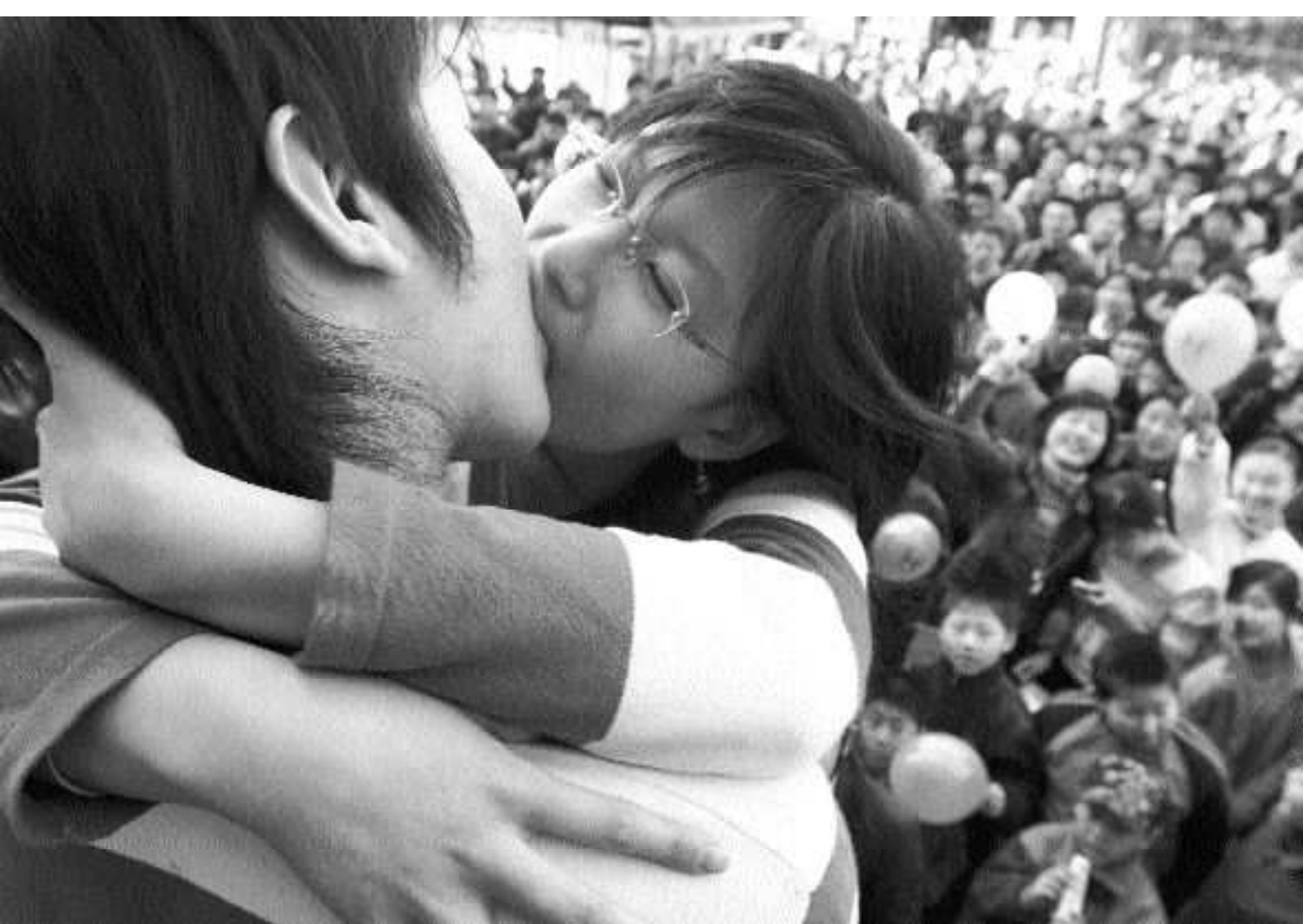
Compétition de baisers, dans le Jilin en 2005