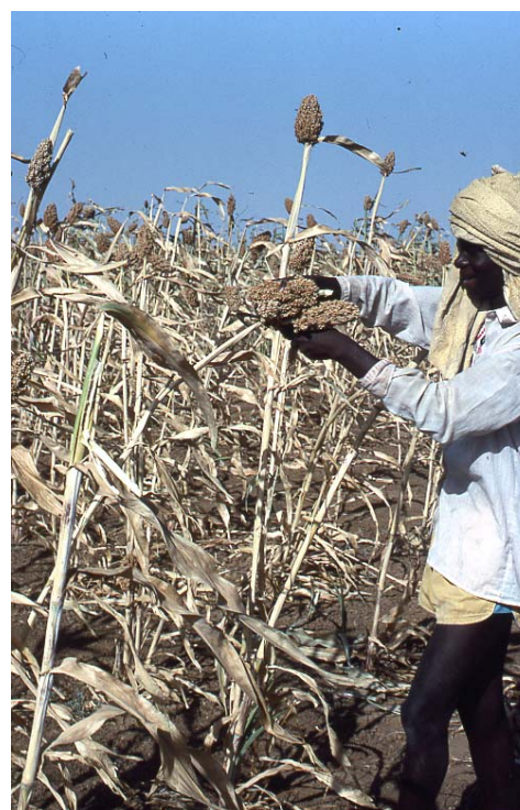
5 – Récolte à la faucille