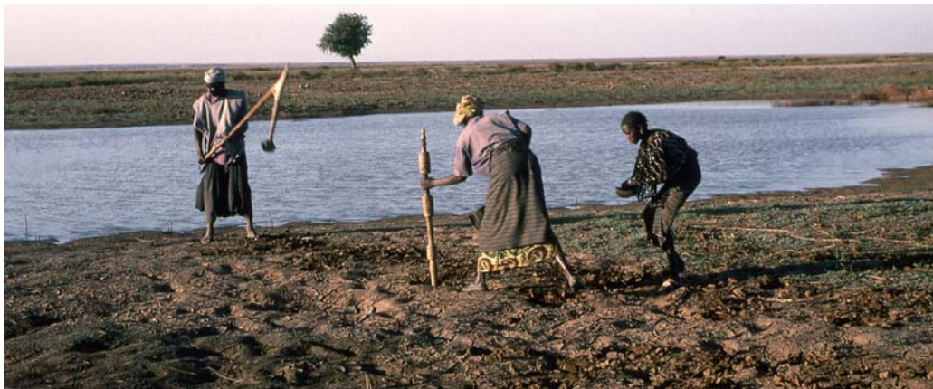
1 – Chantier de semis Le chef de famille découpe la croûte du sol avec la grande houe tongu , sa femme perce un trou avec le plantoir luugal , sa fille y dépose sept graines de sorgho.