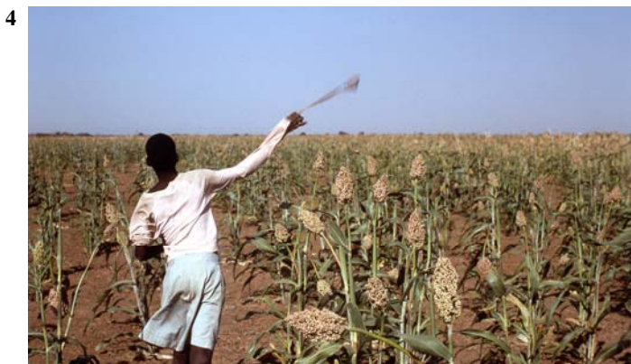
3 Lutte contre les oiseaux : emmaillotage des panicules (3) chasse des oiseaux à la fronde (4)