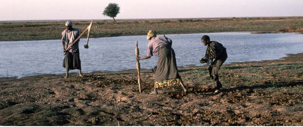
1 – Chantier de semis Le chef de famille découpe la croûte du sol avec la grande houe tongu , sa femme perce un trou avec le plantoir luugal , sa fille y dépose sept graines de sorgho.